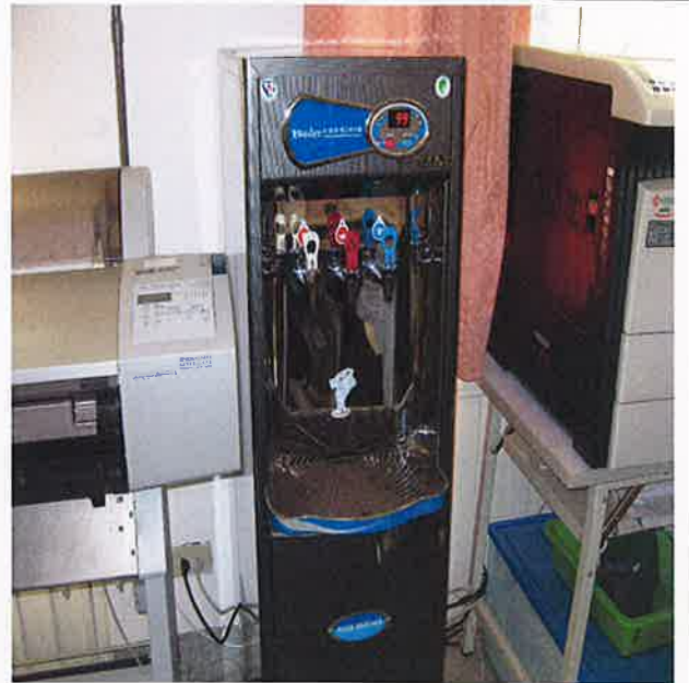
本校飲水機每月保養1次，每3個月水質送檢一次，開學前亦進行保養