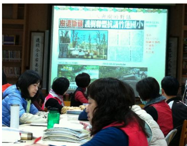
衍生一份思考性的環教課程；