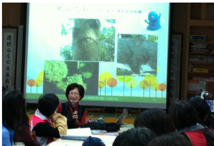
珍愛校樹活動，可以是活潑開心，又充滿創意的。