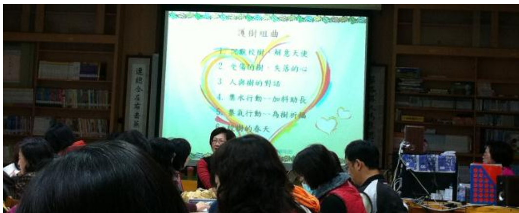
回歸校園立場，探討如何將事件導入教育意涵。