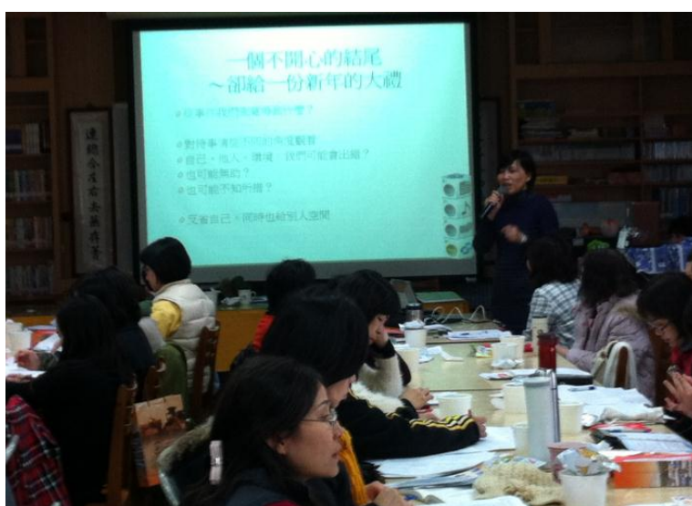
校長說，年終一個不愉快的事件，卻成為一份新年的大禮。