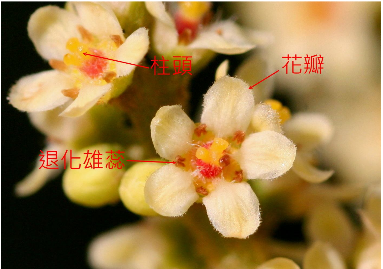
↑ 已授粉的子房開始顯現紅色，退化雄蕊的顏色也變深