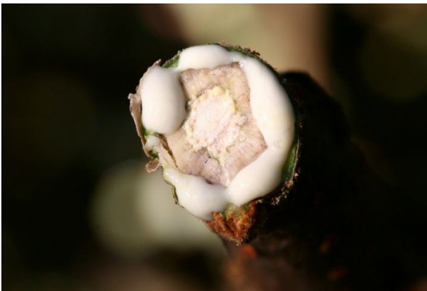
↑由樹皮的樹脂道流出的大量汁液