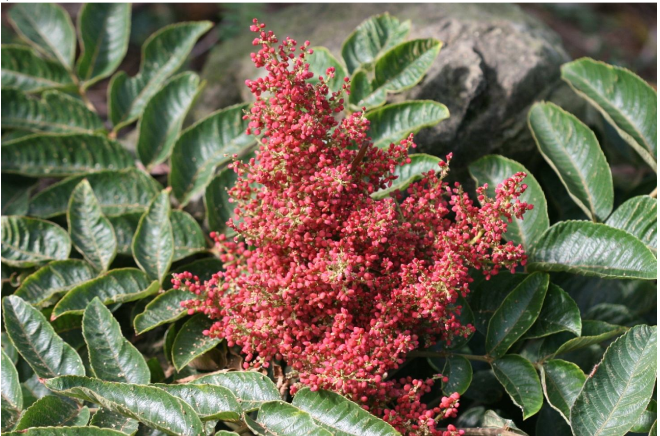
↑ 果序發育的初期呈現醒眼的亮紅色