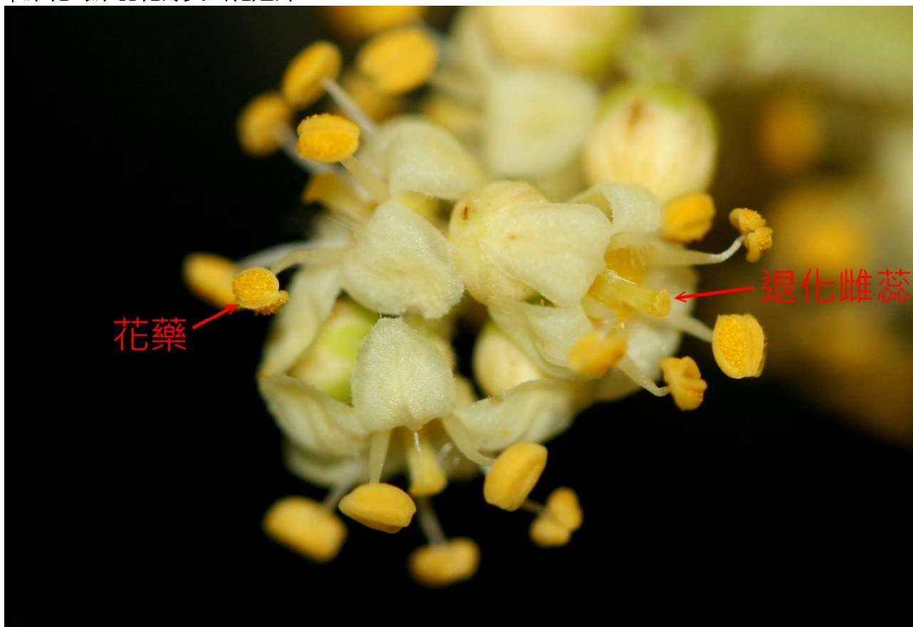
↑ 雄花具有退化雌蕊，但柱頭並未像雌花柱頭一樣三裂