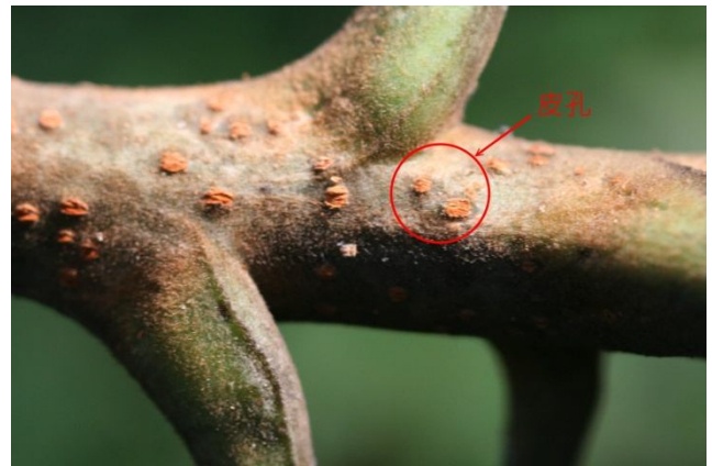
↑枝條上的紅色皮孔