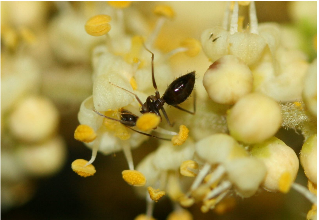
↑小花中吸吮蜜汁的螞蟻