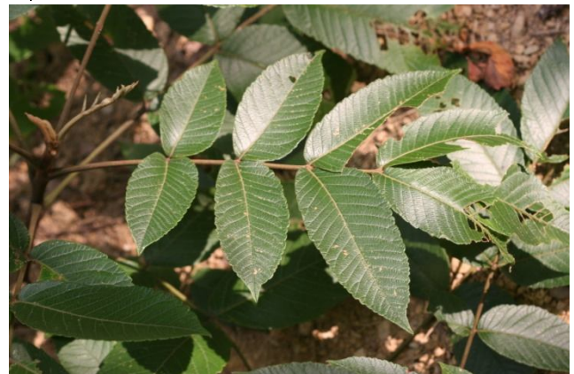
↑開展後的羽狀複葉