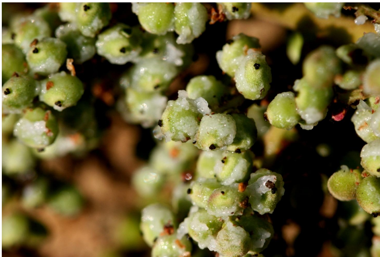
↑ 果實發育後期逐漸泌出白色的鹽類脂狀物是羅氏鹽膚木的最大特色

許多植物體內都有「腺」(gland)的構造，它們好比是植物的分泌系統，提供植物分泌不同的物質，腺在植株上的位置、形態及其所分泌出的物質代表著不同的生態或生理作用，花朵內的腺體多半會分泌蜜汁以吸引昆蟲前來授粉；莖葉上的腺點則常揮發出植物精油，以防止葉片受到啃食。除了分泌蜜或精油之外，有些植物也利用腺體分泌鹽類。