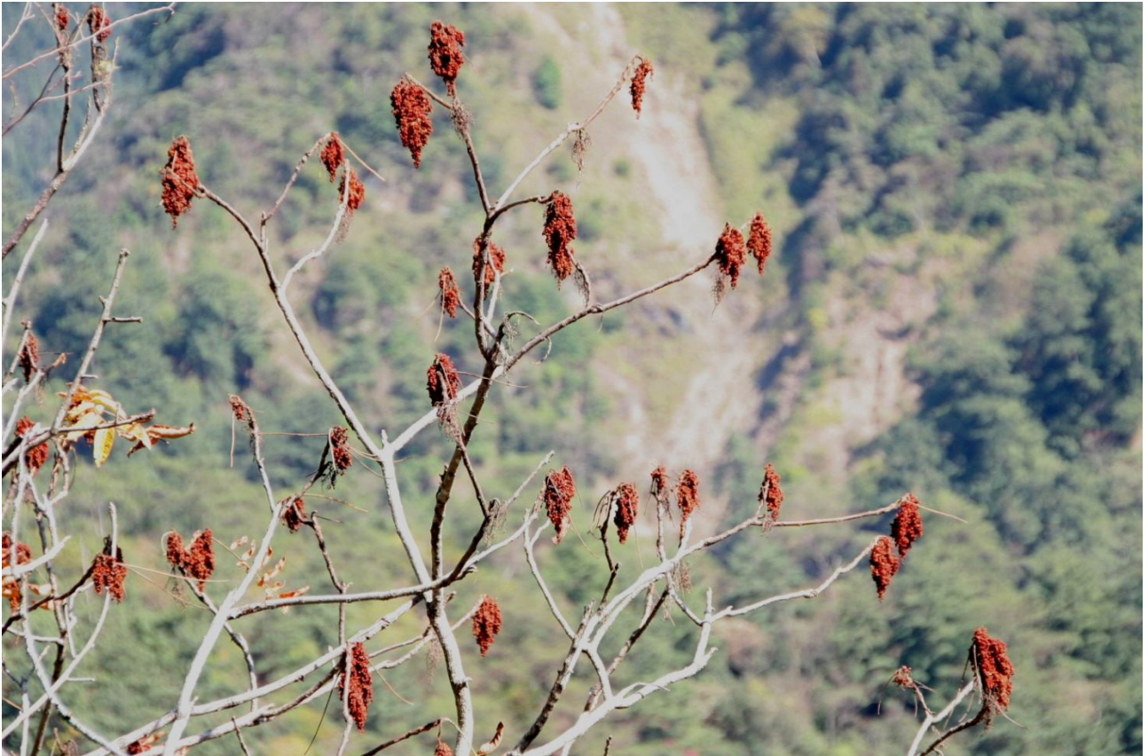
↑ 羅氏鹽膚木進入冬天落葉期後，枝條頂端一串串下垂的果序成為特殊的景致

膚木能成功繁衍的關鍵，但真正讓人眼睛為之一亮的，其實是果實還未分泌出濕濕黏黏的鹽分之前的顏色！