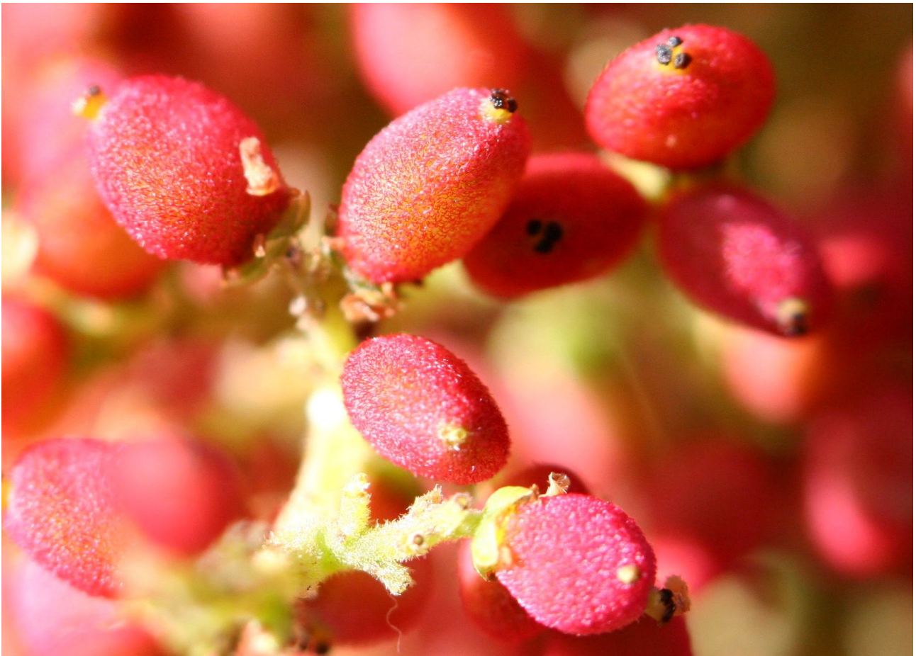
↑鮮紅的果實顏色其實是來自於覆蓋住整顆果實的紅色毛

鳥類的視覺喜好和人類差不多，老是喜歡大紅大紫的，因此許多吸引鳥類取食的植物在果實成熟時都會轉成鮮豔的紅色或紫色，但是羅氏鹽膚木卻在果實發育的初期呈現鮮紅色，然後隨著果實的成熟逐漸淡化，仔細觀察果實的外表可以發現，紅色並非是果皮的顏色，而是來自於一層紅色的毛，這紅色的毛出現的時機頗值得玩味，因為一路往回追溯到羅氏鹽膚木花朵初開放時的雌蕊，子房並未呈現紅色，而是當子房開始從花盤中發育出來時，紅色才開始顯現。換句話說，還未授粉的花朵，雌蕊子房不是紅色，完成授粉後的雌蕊子房才會變成紅色。這可能有兩種原因，第一是因為剛開始茁壯的子房還很嬌嫩，可能無法抵禦強烈陽光的照射，被覆一層紅色的毛可以避免灼傷（中高海拔的植物經常如此）；第二則是傳達出花朵已經授粉的訊息，告訴傳粉者這朵花已經不提供花蜜，請傳粉者直接前往下一朵，以節省訪花的時間。