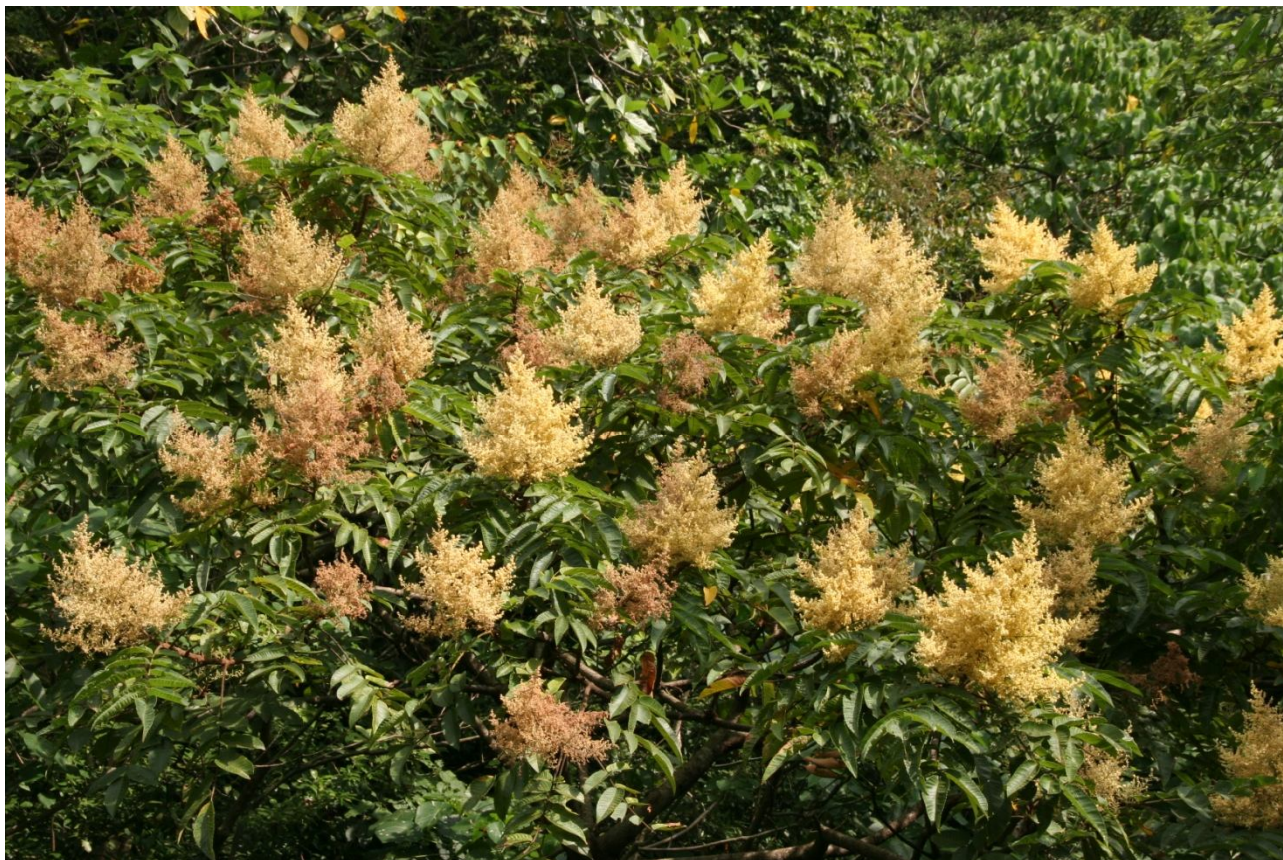
↑羅氏鹽膚木的花朵數量驚人，但花朵卻小到如同小麥皮屑一樣而被稱為麩

數量這麼多的小花必須要吸引夠多的傳粉昆蟲前來才能有好的授粉效果，所以不管是雄花或雌花，在花冠的底部都有蜜腺分泌蜜汁藉以吸引傳粉昆蟲，花朵盛開時可以見到許多蜂或蠅等昆蟲前來訪花，而在這些小花中也常常能看到螞蟻前來分一杯羹，螞蟻甚至就築在羅氏鹽膚木植株上，這些螞蟻雖然前來訪花，但對傳粉應該沒有甚麼幫助，雌雄異株的羅氏鹽膚木若要靠螞蟻將花粉從這棵樹傳到另一棵樹去恐怕是緩不濟急，雖然螞蟻對羅氏鹽膚木的授粉沒什麼注意，但卻有其他物種能從中得利，根據林春吉在〈台灣蝴蝶食草與蜜源植物大圖鑑〉一書中對羅氏鹽膚木的描述，姬雙尾燕蝶便常將卵產在羅氏鹽膚木的枝條上，讓孵化的幼蟲與螞蟻共生或攝食羅氏鹽膚木的嫩葉為生。