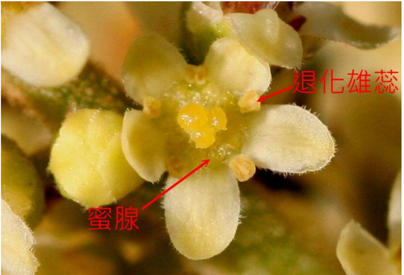
↑ 尚未授粉的雌蕊子房未顯現出紅色