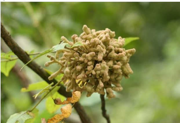
↑俗稱五倍子的蟲瘻