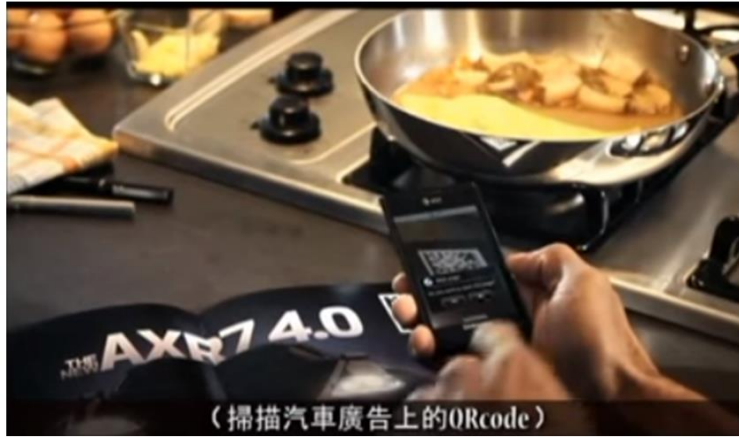
(掃描汽車廣告上的QRcode)