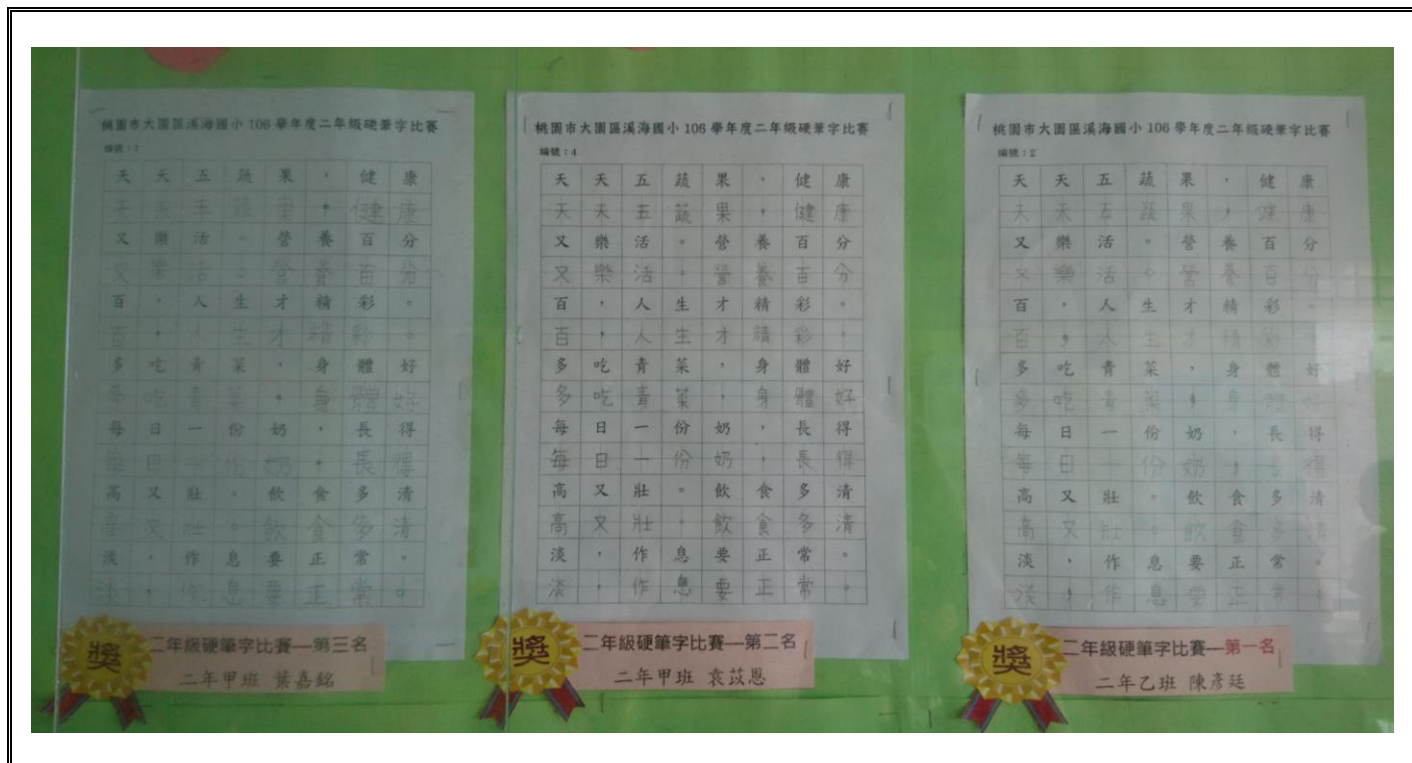
辦理營養教育硬筆字比賽