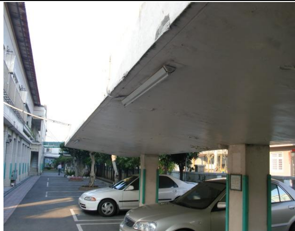
更換省電 LED 燈管－停車場