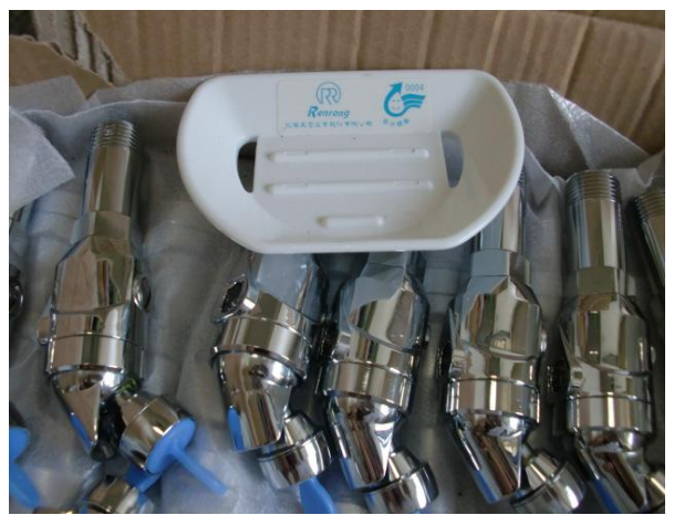
節約用水用電具體作為—省水龍頭