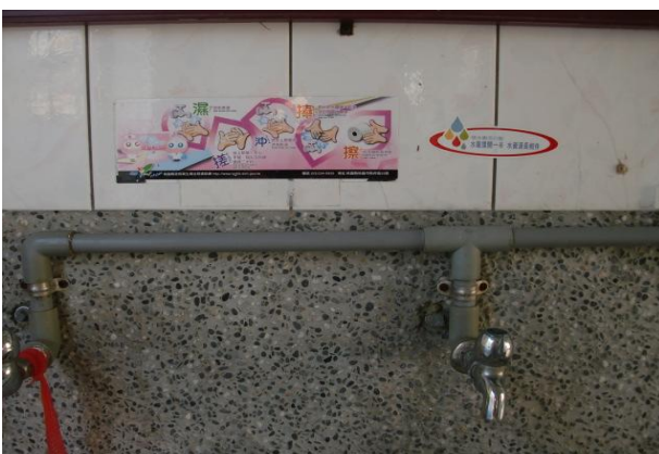
節約用水用電具體作為—省水宣導