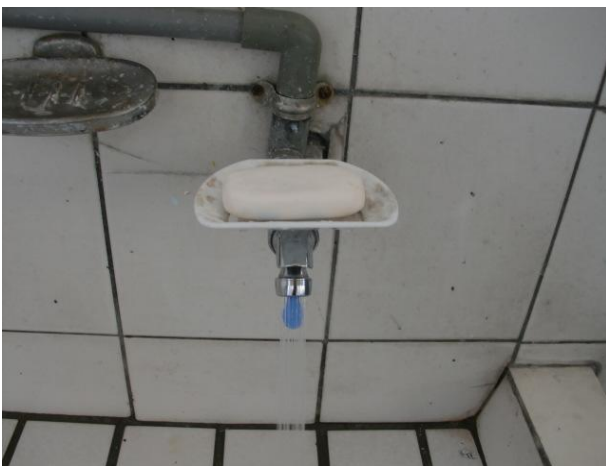
節約用水用電具體作為—省水龍頭