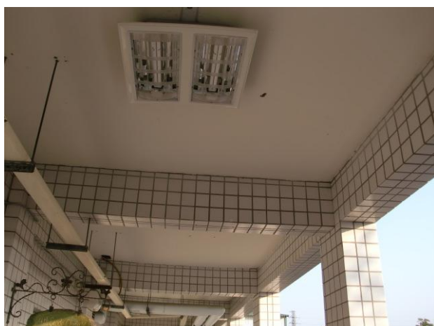
更換省電照明燈管－走廊