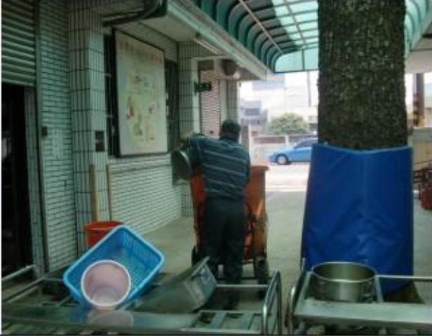
結合社區志工－廚餘回收再利用