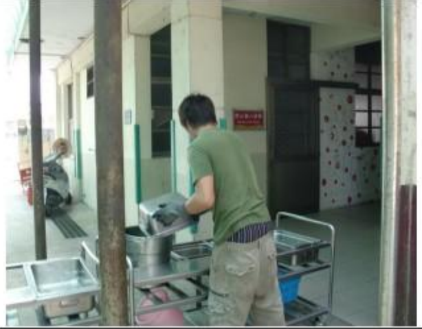
結合社區志工－廚餘回收並協助推餐車