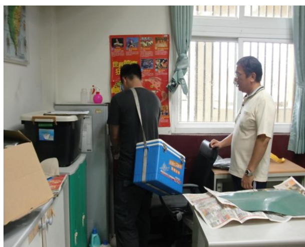
飲水定期送檢化驗與養護—班級教室