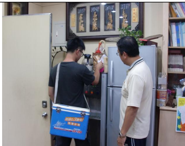
飲水定期送檢化驗與養護—校長室