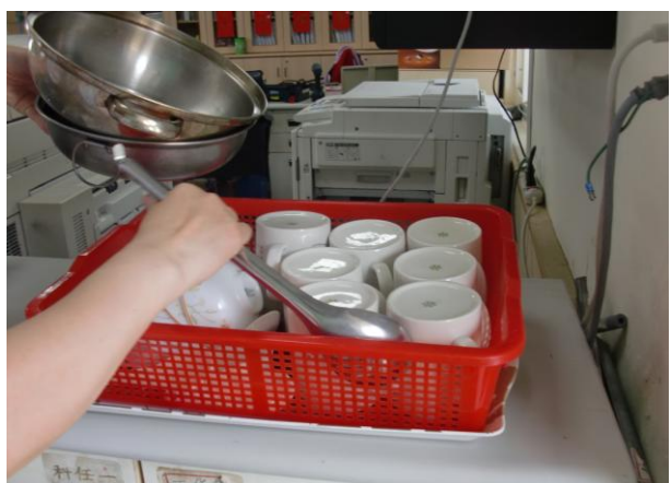
提供教職員工生備用餐具及茶杯