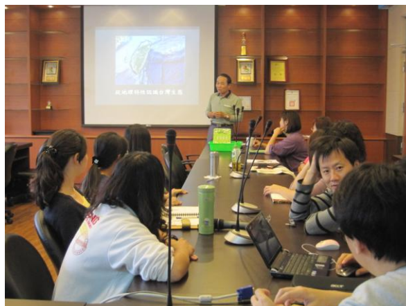
教師參加研習時主動攜帶自己的水杯