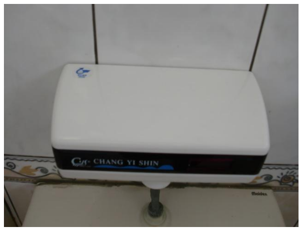
節約用水用電具體作為—感應系統