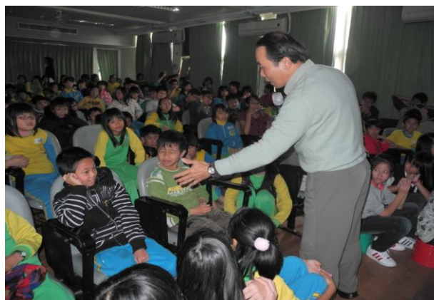
講師與學生對多喝水的好處討論及互動