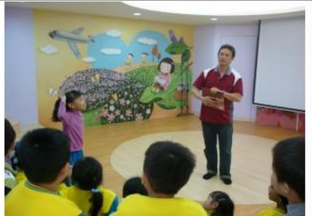
愛心爸爸藉由繪本引導孩子珍惜食物