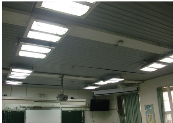
更換省電照明燈管－教室