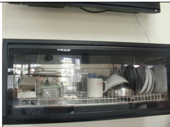
辦公室內有烘乾設備可讓教職員工使用