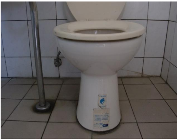
節約用水用電具體作為—省水馬桶