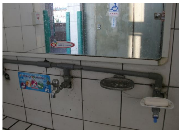
節約用水用電具體作為—省水宣導