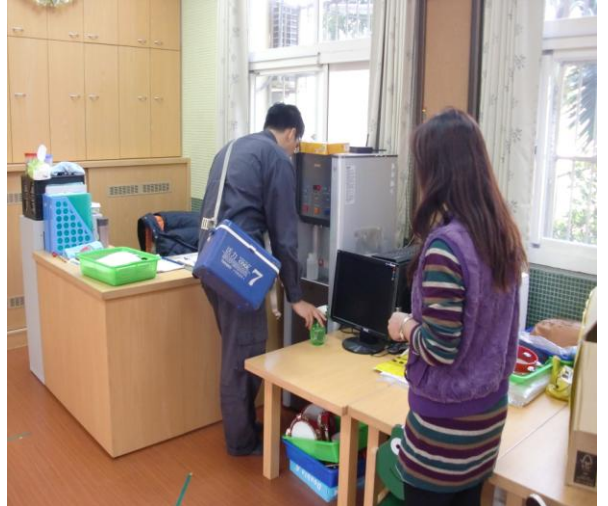
飲水定期送檢化驗與養護—幼兒園