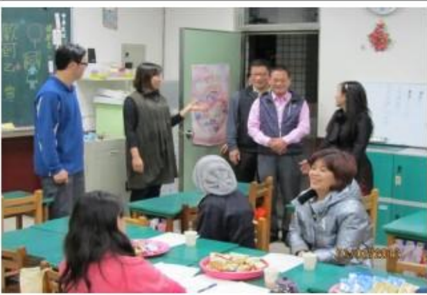
家長會長及校長宣導廚餘減量