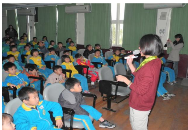
利用宣導活動強調多喝水好處