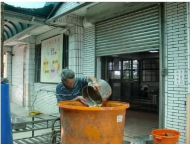
結合社區志工－廚餘回收及環境整理