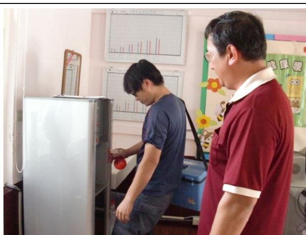
飲水定期送檢化驗與養護—保健中心