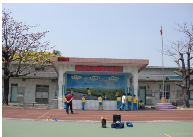
校園 LED 跑馬燈宣導拒用免洗餐具