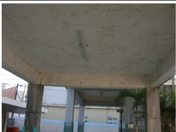
更換省電 LED 燈管－廁所旁走道