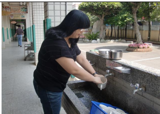
學校提供馬克磁杯供老師使用