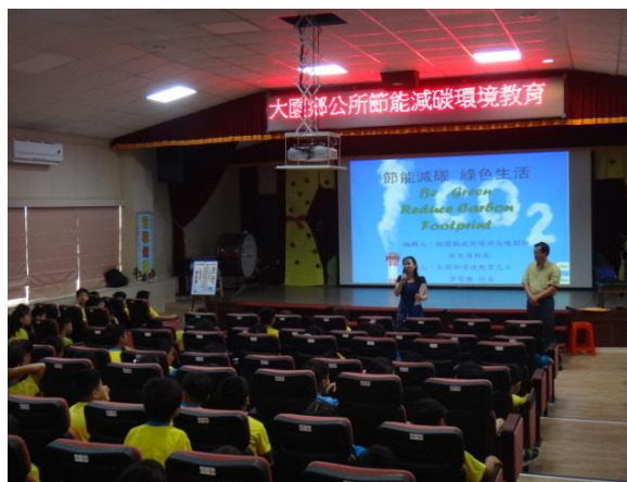
校長利用環境教育宣導推動使用環保杯