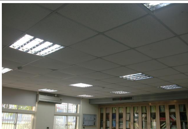
更換省電照明燈管－辦公室