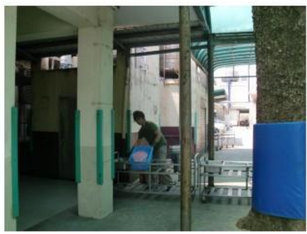
結合社區志工－廚餘回收及統計廚餘