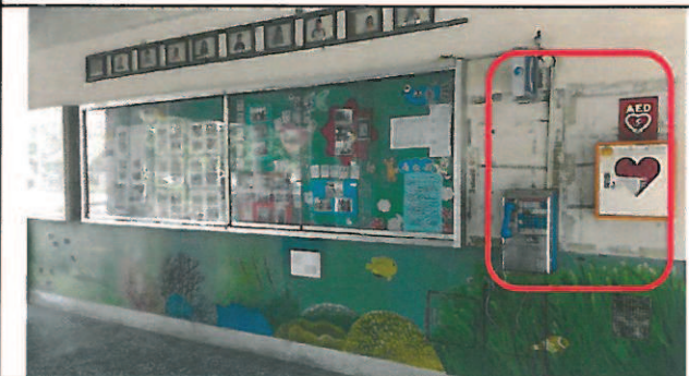
原川堂西側牆面斑駁、未整體規劃設計