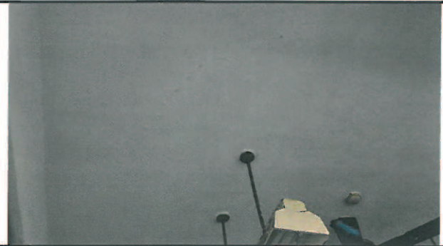
透過專業防水注射處理後，天花板遇下雨已無漏水問題