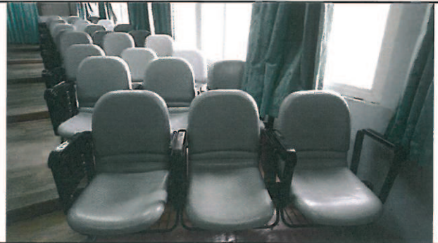
修繕後的座椅讓參與聽講師生坐得更安全與舒適