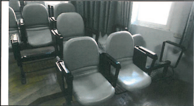
視聽教室四張座椅損毀