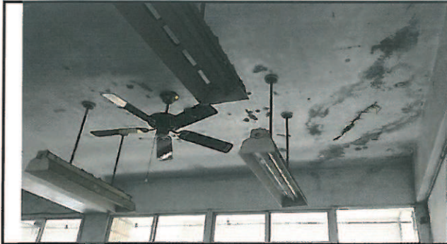
五乙教室天花板裂縫處每逢下雨便出現漏水現象