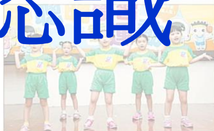
▲運動讓你更健康與聰明，教育部昨天邀請小朋友代宣，鼓勵大家多運動。

【臺北報導】教育部最新公布，中小體育課時數，比歐美少一半。根據統計，我國中小體育課每週平均7.8節，而歐美則在15節左右。教育部表示，體育課時數不足，可能是因為學校空間不足、設備不全、或教師專業不足、偏向靜態教學。 教育部體育署長李榕仁表示，依據九年一貫課綱規定，健康與體育領域的課時數為總上課時數的百分之十，有的學校可能採取低標百分之十，有的體育特色學校可能採取百分之十五高標。