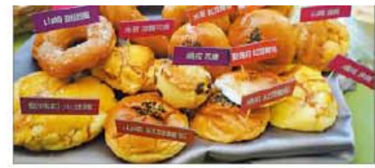
知名連鎖麵包店的麵包，含鋁量高，吃多會影響健康，民眾選擇時得多... 攝影/吳欣恬

【台北報導】知名連鎖麵包店「康、含鋁」吃多會影響健康，民眾選擇時得多... 攝影/吳欣恬 知名連鎖麵包店的麵包，含鋁量高，吃多會影響健康，民眾選擇時得多... 攝影/吳欣恬 知名連鎖麵包店「康、含鋁」吃多會影響健康，民眾選擇時得多... 攝影/吳欣恬