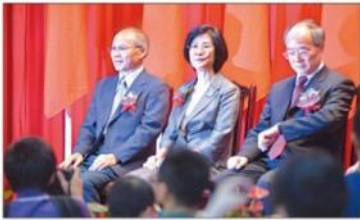
接下重擔 ▲法務部昨日舉行部長交接典禮，新任部長羅瑩雪（中）出席，特偵組長黃世銘（右）也出席。圖為特偵組全體合影。▲法務部昨日舉行部長交接典禮，新任部長羅瑩雪（中）出席，特偵組長黃世銘（右）也出席。圖為特偵組全體合影。

社論 有熱情的教師到哪去了？ 中小學已經開學一個月了，教師、學生又逐漸回到教學、學習的正軌。然而，許多離島、偏遠地區，教師流動率偏高，教師聘用困難，到目前還無法聘足師資，使正常教學受到嚴重的阻礙。 以離島的蘭嶼中學為例，開學至今，歷經七次的教評會，好不容易才聘足兩名數學與一名自然科學代課教師，但沒想到上課才一星期，自然科學代課教師離職，到高雄捷連擔任司機員，自然課又要開天窗了。 離島地區師資缺乏情況嚴重，為了讓教師留在島上持續教學，自去年起，《離島建設條例》規定，編制內教師必須在離島教學四年，才可申請轉調。但這樣的規定卻造成「愛之反倒害之」的後果，讓許多符合資格的教師望而卻步，不敢前來應徵，學校只好招聘代課教師，但因代課教師一年一聘，也無法找到適任的人才。 教師是教學的最基本必要條件，若連教師都無法聘足，正常教學都有困難，更遑論要提升教學品質。多少師資培訓中心培育出的教師，都強調自己是何等的熱愛教育，願意為教育犧牲奉獻；但對生活較為困難的離島、偏遠地區時，許多教師的教育愛、奉獻心就消失得無影無蹤。我們不禁要問：「有熱情的教師到哪去了？」