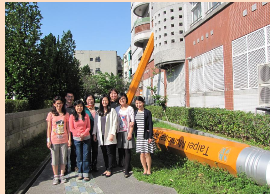
左圖：香港陳一心家族慈善基金會蒞校參訪。