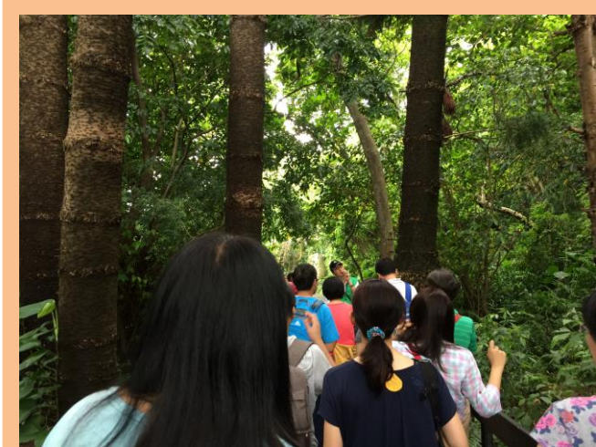
上圖：參觀傷鳥救護中心。