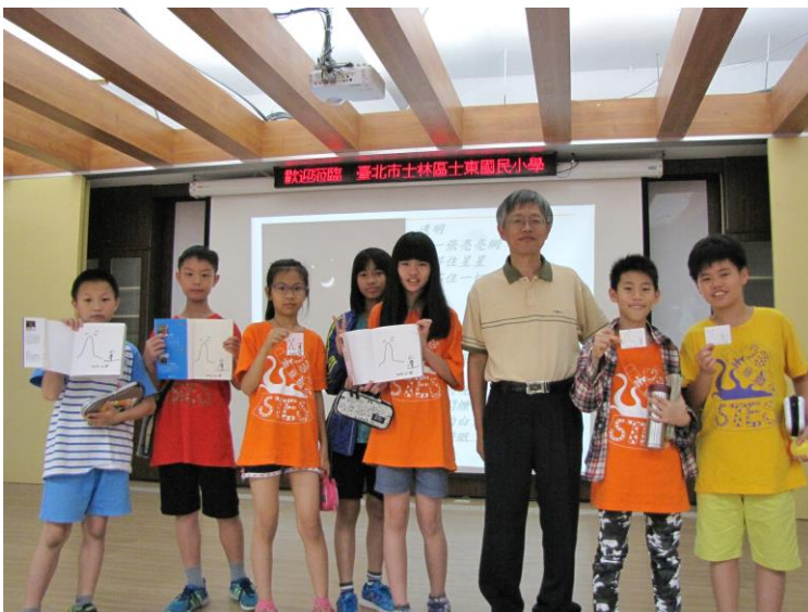
左圖五年級同學們與作家山鷹老師合影。

會後與作家的問與答、簽書會，將活動推到了最高潮，山鷹叔叔也贈送了一本《星空動物園》回饋給士東國小的學生，讓這次見面會畫下完美的句點。