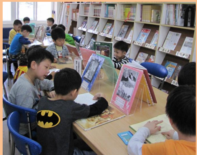
左圖：學生瀏覽展版故事，學習莎士比亞名言。 右下圖：閱讀經典作品，感受莎士比亞的文字魅力。