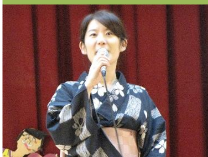
上圖: 健成 媽媽平日為日本導遊，特別請假為 士東國小 全體學生籌辦此次的日本文化祭。