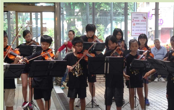
上圖：士東國小弦樂團在士東市場全體團員及指導老師(中間白衣)的合照。 下圖：五月三日士東國小弦樂團應邀在士東市場演奏，吸引市場內正忙著採買的婆婆媽媽駐足，欣賞悅耳動人的曲目。