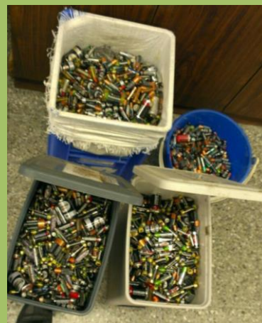
四圖：為家長會志工們於家長會辦公室內設置廢電池回收站，清點廢電池數量。