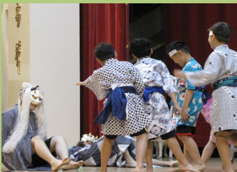
左圖: 士東國小教師 (左, 倒地二人) 扮演鬼面惡人, 被穿著 浴衣的孩子們 所擊倒, 以打 倒鬼面惡人揭 開此次日本文 化祭的活動。