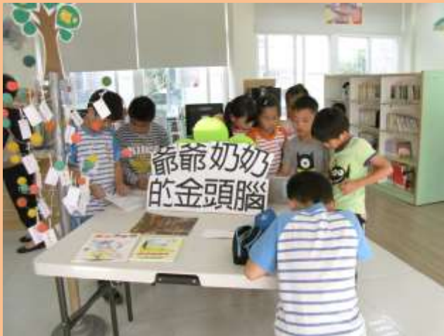
學生閱讀繪本與欣賞音樂影片。