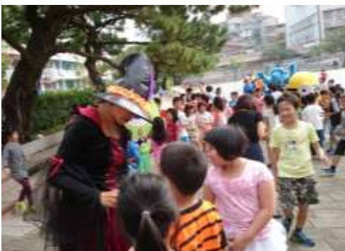
身體彩繪是孩子們最喜愛的活動。

謝謝家長會與志工們的精心策畫，透過這精采的萬聖派對，大家都度過了開心又多采多姿的一天！