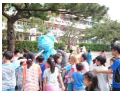
大毛怪到操場上引起一陣騷動。