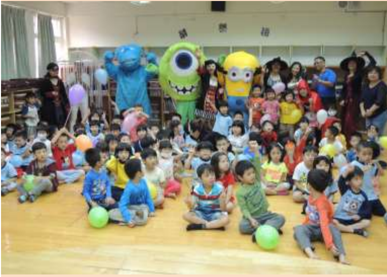
左圖: 幼兒園的大團照。