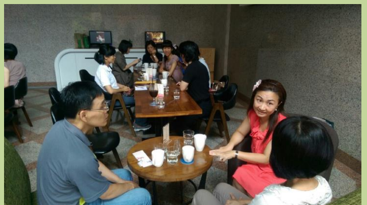
志工意猶未盡，留下繼續下午茶話家常。