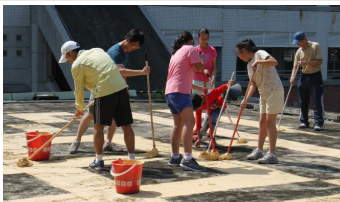
師生頭頂烈日，手揮大毫。