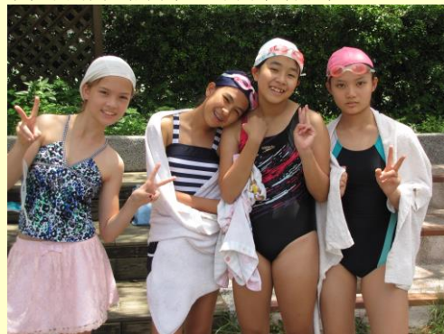
身手矯健的四大運動美少女。