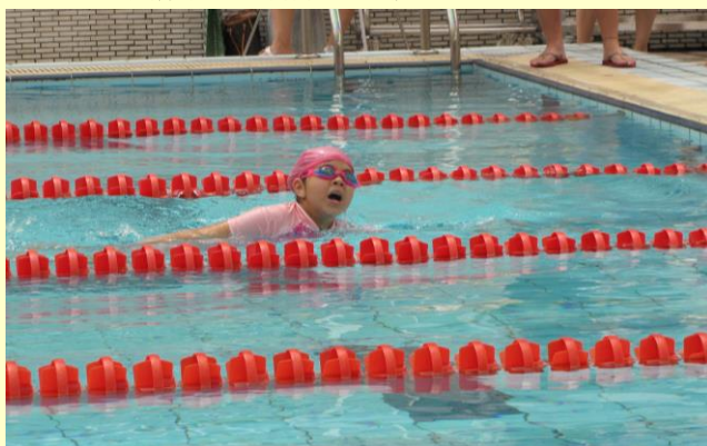
我年紀雖然小，但是我的鬥志很高昂，絕對不輕易放棄。