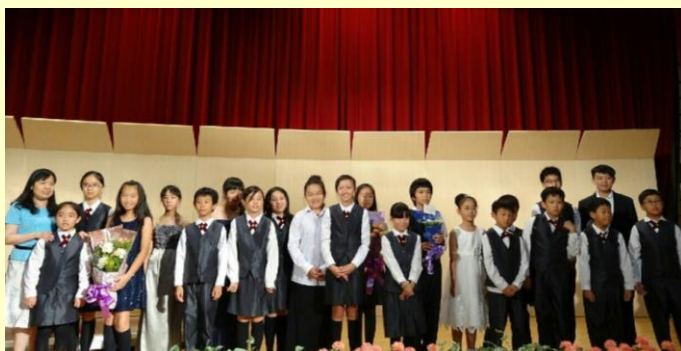
演出完畢，弦樂團師生與校長大合照。