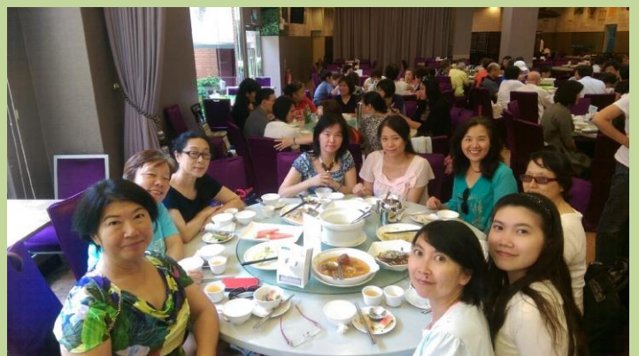
志工們在寬敞舒適的餐廳中，開心的用餐合影留念。

志工們是學校裡各項活動重要的推手，家長會除了感謝還是感謝，期待有更多熱心、熱情的你/妳，加入我們！