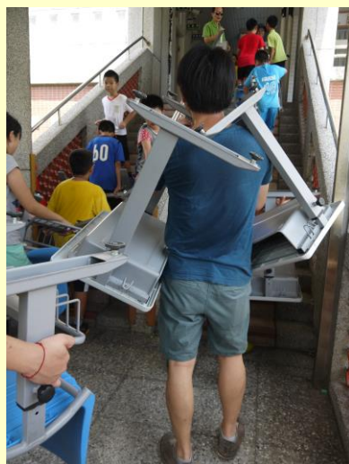
孩子不要學，老師練過的。