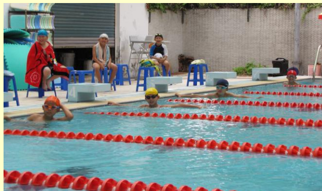
各路好手已就預備位置，猜猜看誰能勝出呢？