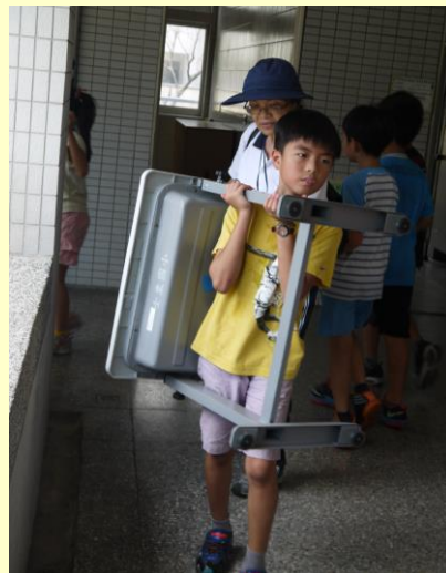
雖然搬很多趟，大家還是精神奕奕。