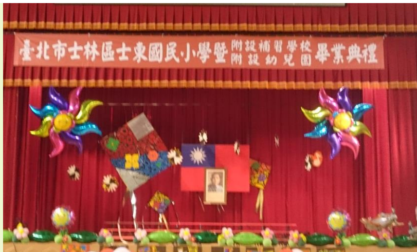
畢典場地布置得美輪美奐。

本校第七十一屆國小暨補校畢業典禮，於 6 月 22 日於活動中心舉行，當日共計有國小 136 位畢業生及補校 16 位畢業生，在畢業生親友及多位貴賓與師長的見證下，完成小學階段的求學歷程，並將帶著滿滿的祝福，踏上另一階段的學習旅程。