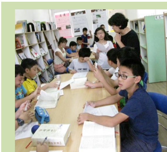
左圖: 學生查字典尋找詩經中的文字含義。

書展期間,小朋友還可以挑戰「一口氣背古詩」的活動,看小朋友彼此應和,或一同朗誦,增添了不少趣味。