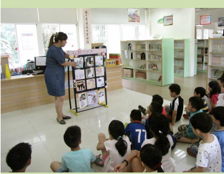
左圖:閱讀老師運用九宮格翻板,介紹詩經12首詩。