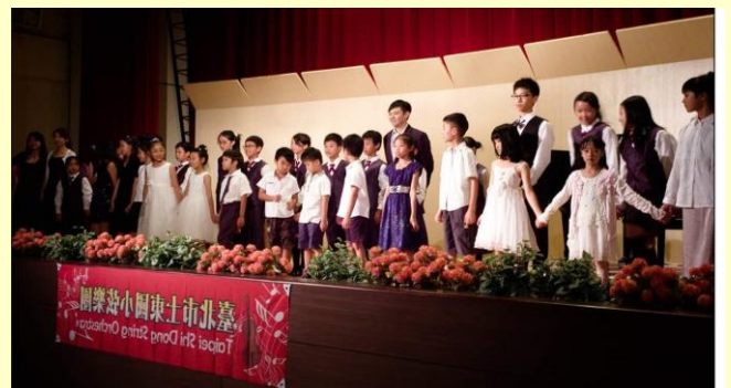
演出完畢，弦樂團及課後管弦樂班師生大合照。