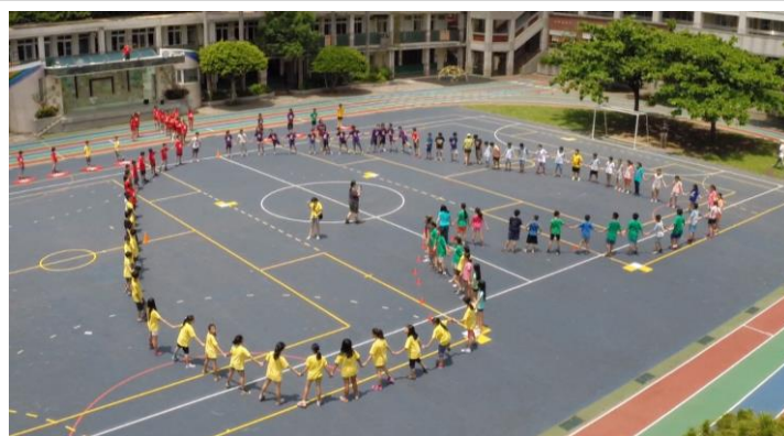
5年級告別南棟活動，以空拍機記錄。