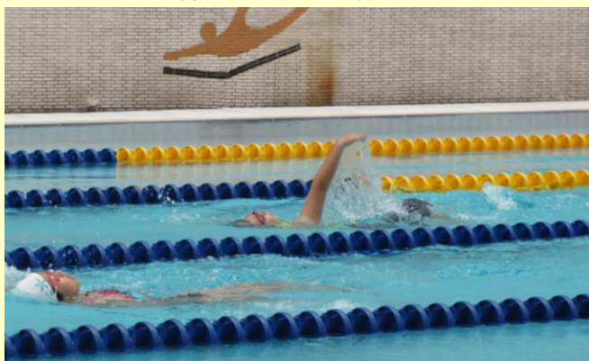
仰式不是人人都會的，瞧瞧我倆優美的泳姿。