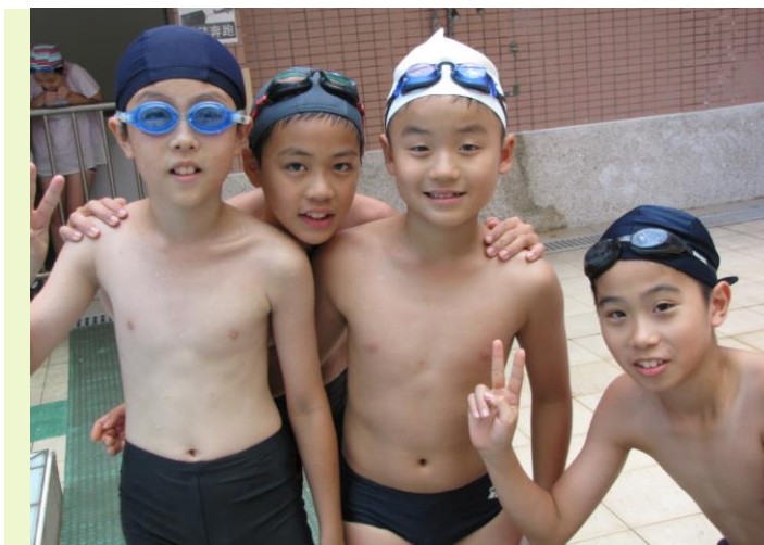
左圖 六年一班四大猛將 比完賽來個勝利的大合照。

在天氣晴朗、風和日麗的六月時節，親師生眾所期盼的游泳比賽熱鬧登場，6月17日由我們即將畢業的六年級同學們率先開賽，其中重頭戲-大隊接力在一番激烈較勁下，由604、606、601奪下前三名，畢業前夕在士東留下美好的回憶。