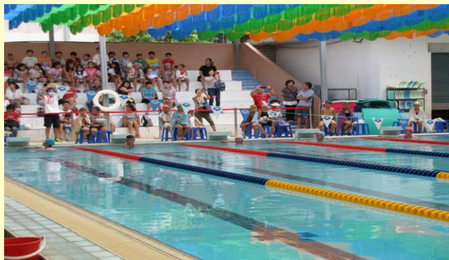
比賽即將開始，選手蓄勢待發，觀眾拭目以待。