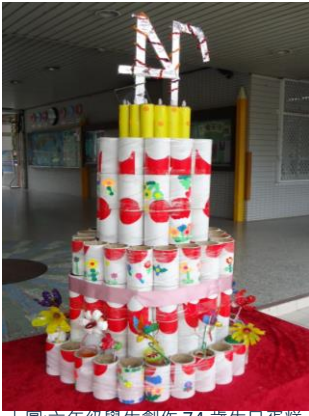
上圖:六年級學生創作 74 歲生日蛋糕。