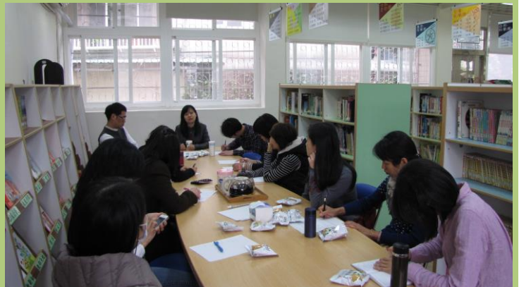
上圖：圖書志工們與校長、老師們正在討論本次書展細節。