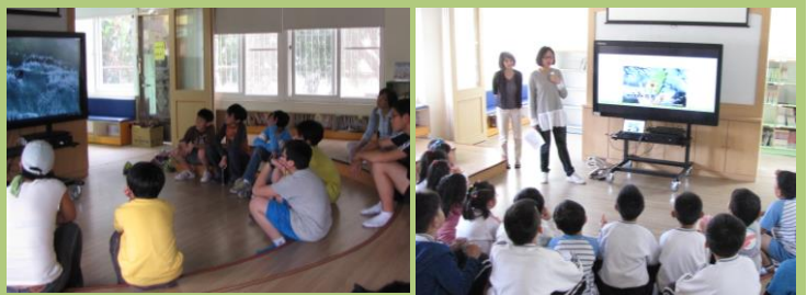
下方二圖：班級學生於圖書館繪本區聆聽書展簡報區，掌握書展主題。