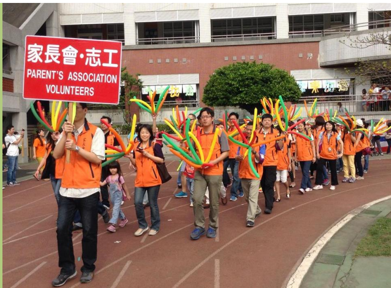
左圖: 士東國小第七十四屆校慶體表會，家長會團隊偕全體志工進場，為士東國小七十四歲生日獻上祝福。