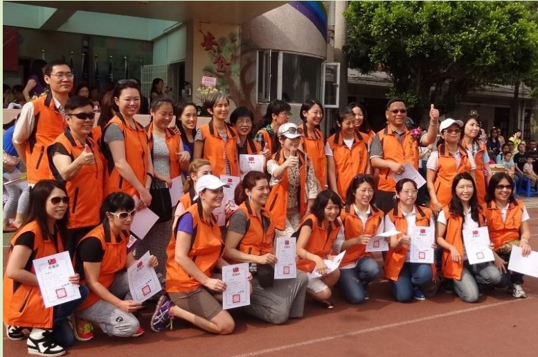
左圖:校方於校慶當天(3/29)表揚全體志工群,感謝志工們的辛苦付出,並致贈感謝狀。