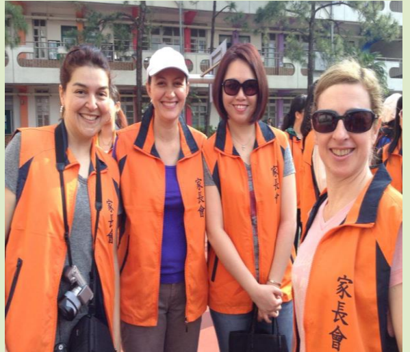
右圖:本學年度初成立的多元文化志工,分別來自巴西、美國、新加坡及葡萄牙(由左至右)。