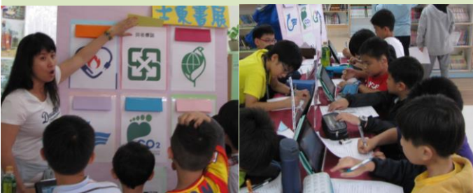
左下圖：節能減碳標章猜一猜。