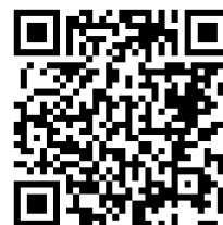
桃園市公立及非營利幼兒園 招生網