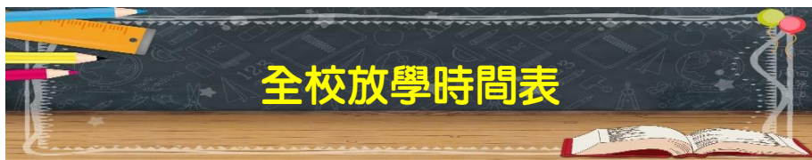
桃園市大業國小 111 學年度第一學期 學生作息表