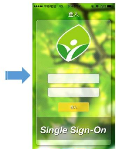
圖 2 帳密輸入頁