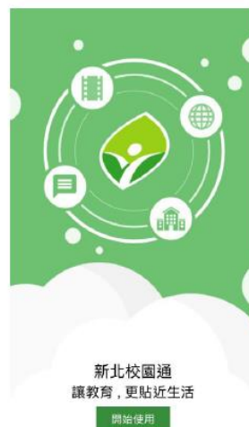
圖 1 APP 歡迎頁