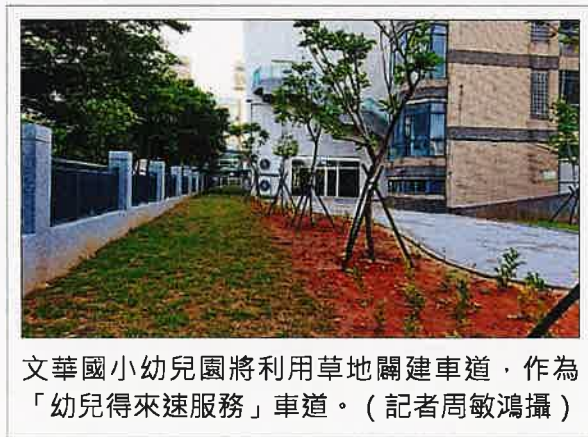
文華國小幼兒園將利用草地闢建車道，作為「幼兒得來速服務」車道。

家長屆時將從文化七路進入「幼兒得來速服務」車道，行駛一百六十公尺後，右轉經過eTag感應設備，車牌號碼就會輸入車牌辨識系統，讓幼兒園能同步得知是哪位幼兒的家長車輛抵達，並安排老師帶著幼兒到大門等待，而家長順路再前進一百四十公尺後右轉文東五街，抵達大門時不必下車就能輕鬆接到孩子。