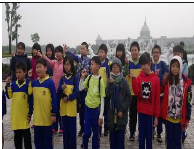
照片說明：奇美博物館外面