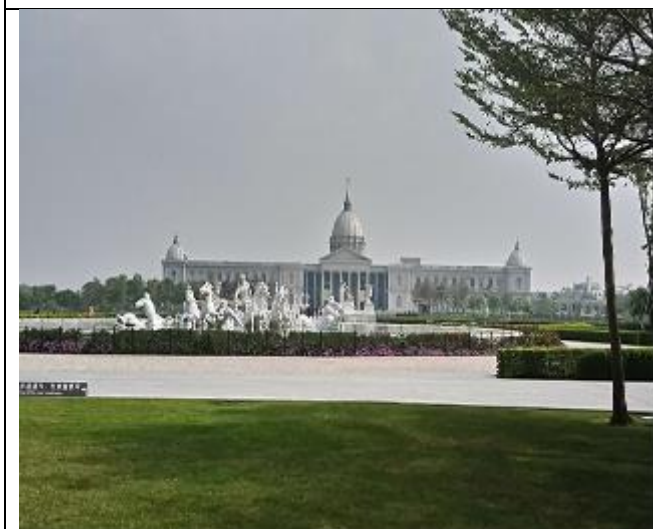
照片說明：奇美博物館