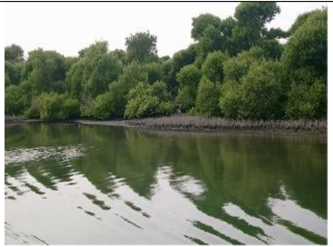
照片說明：紅樹林景觀