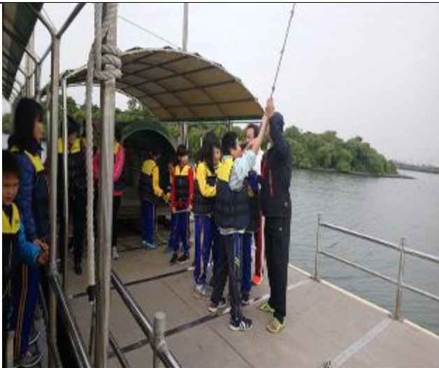
照片說明：大家用力將吊針拉起