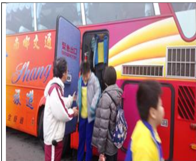
照片說明：逃生演練