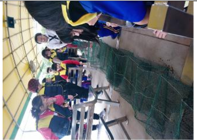
照片說明：定置網捕魚解說