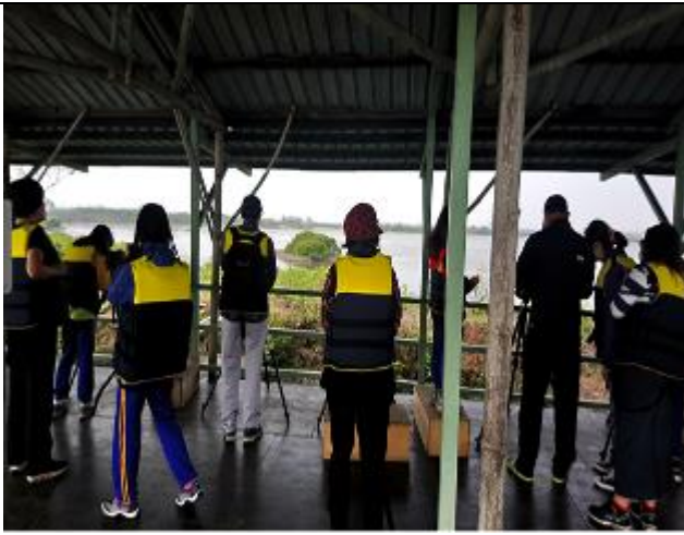
照片說明：使用望遠鏡賞鳥