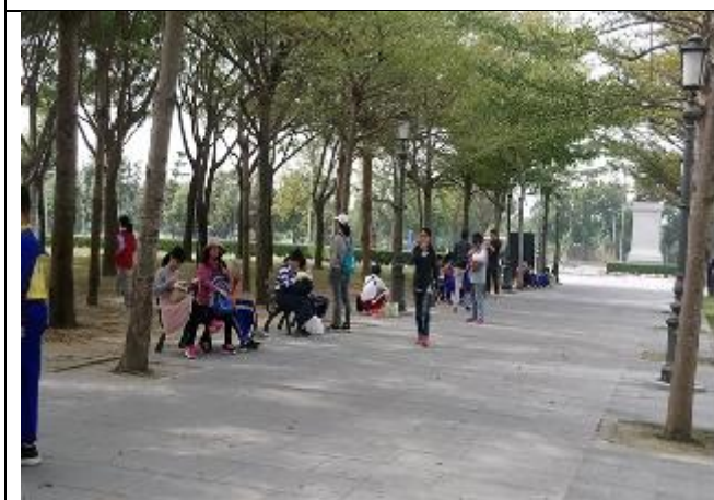
照片說明：林蔭大道處用餐