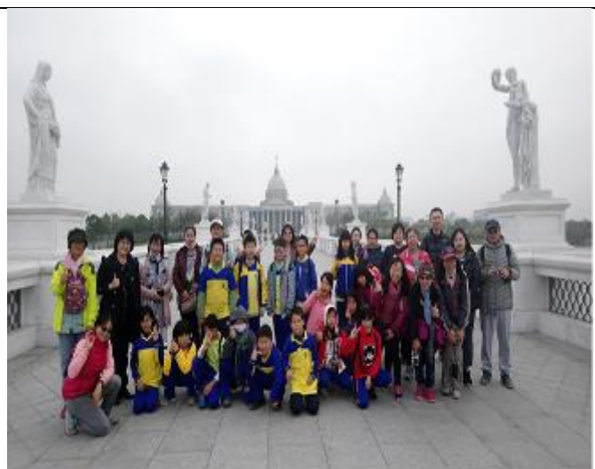
照片說明：全員集合