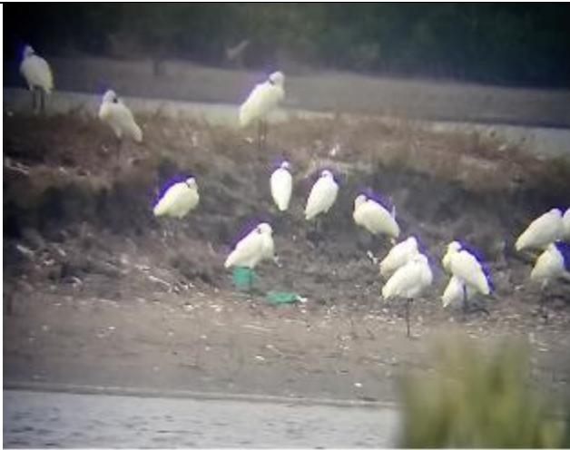
照片說明：看到黑面琵鷺