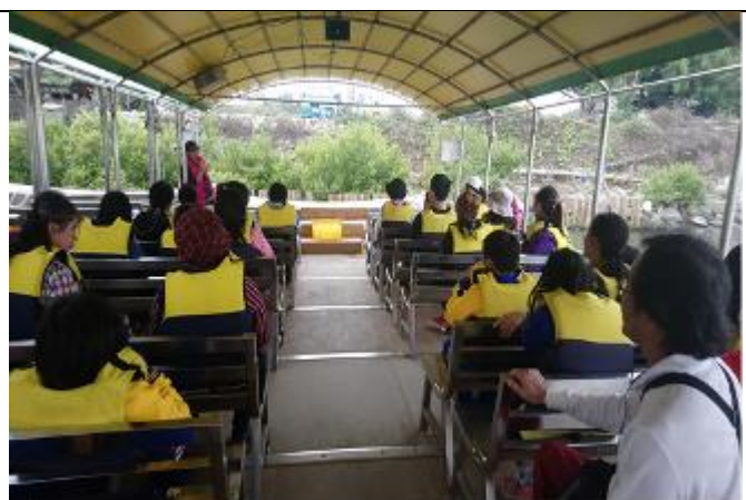
照片說明：四草大員港坐船出發