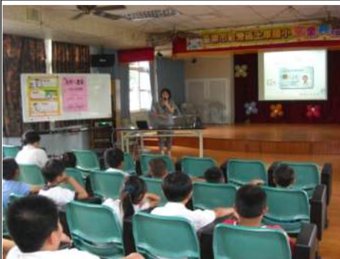
護理師宣導「全民健保」觀念