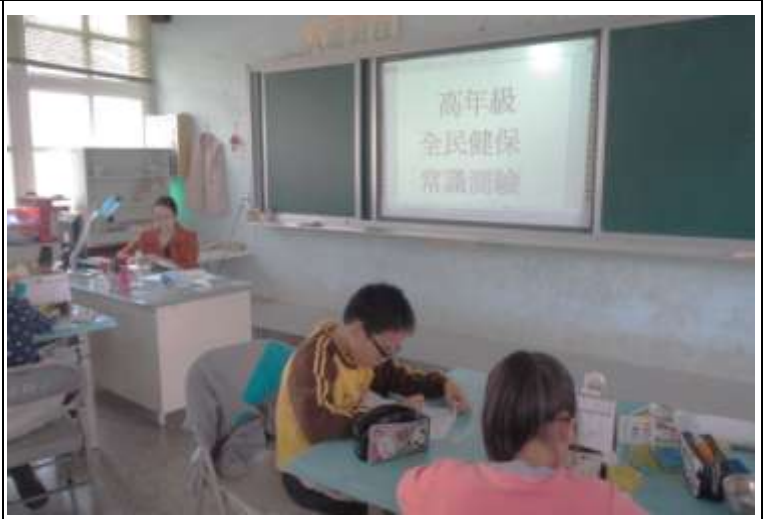
高年級學生「全民健保」常識測驗