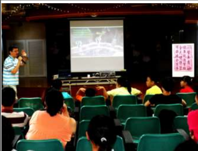
外聘生達藥廠藥師蒞校向家長、學生和教師宣導「全民健保」觀念