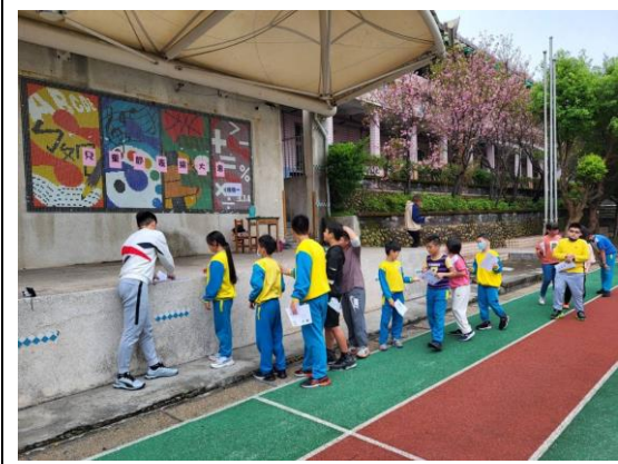
說明：兒童節系列活動