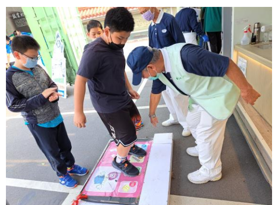
說明：戶外活動~慈濟回收站體驗