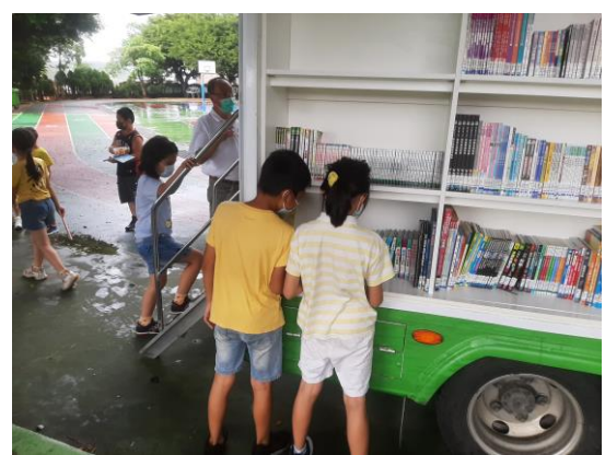
說明：戶外活動~行動書車