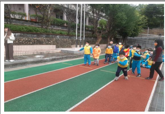
說明：戶外活動~低年級接力賽