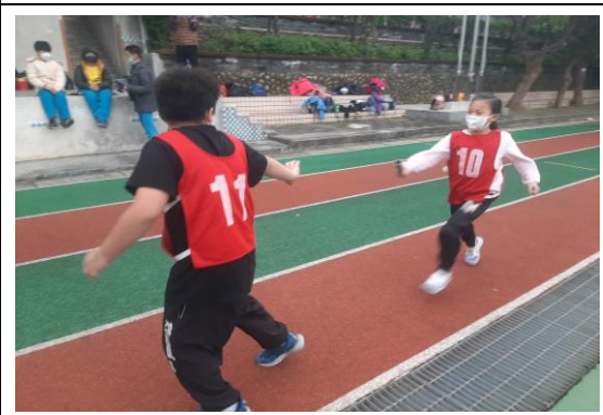
說明：戶外活動~中年級接力賽