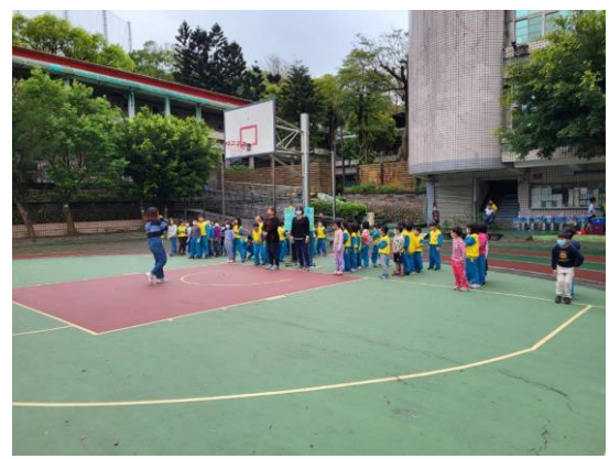
說明：兒童節系列活動