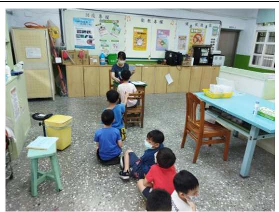
說明：學校護理師對低年級斜弱視檢測