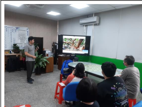
說明：教師護樹研習(上學期)