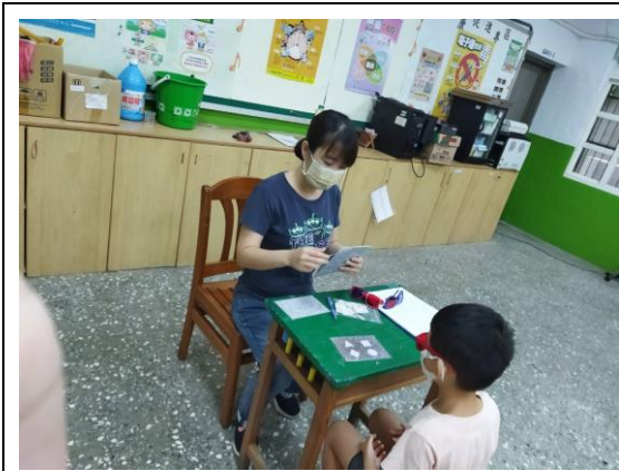
說明：學校護理師對低年級斜弱視檢測