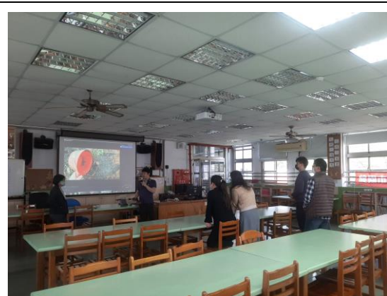
說明：教師護樹研習(下學期)