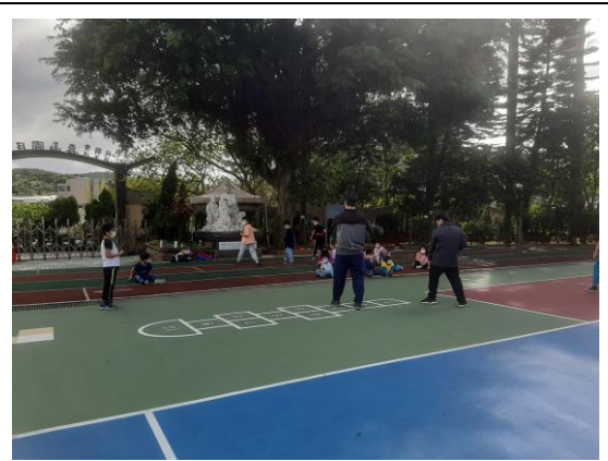
說明：戶外活動~跆拳道