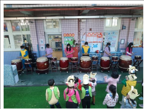
說明：戶外活動~太鼓表演