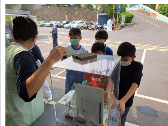
說明：戶外活動~慈濟回收站體驗