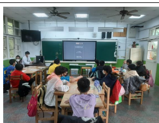
說明：長庚醫師到校宣導視力保健