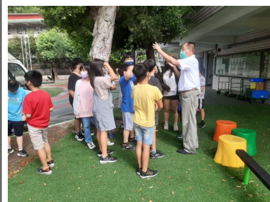
說明：戶外活動~行動書車