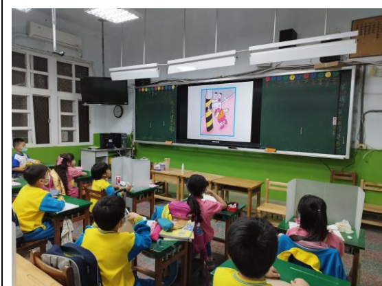
說明：視力保健影片宣導