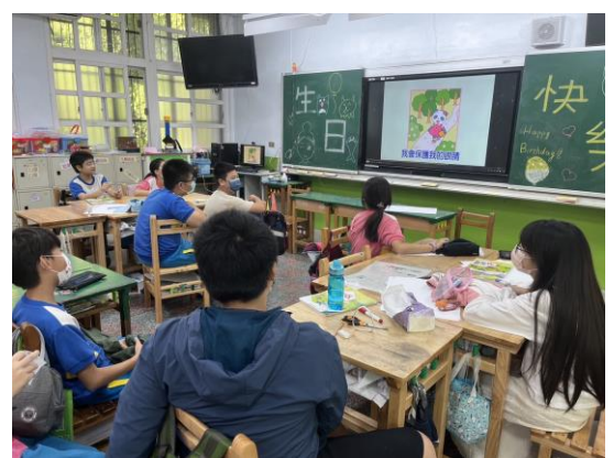
說明：視力保健影片宣導