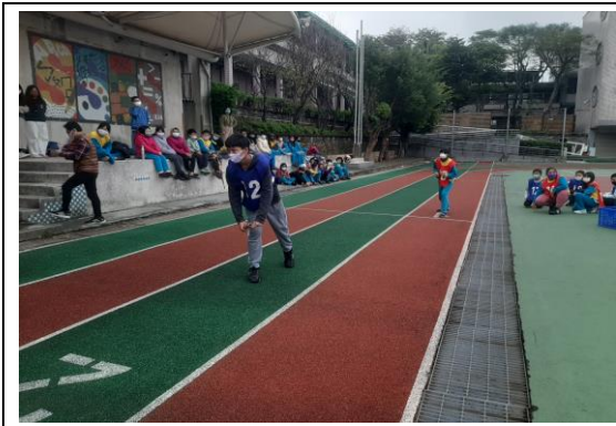
說明：戶外活動~低年級接力賽