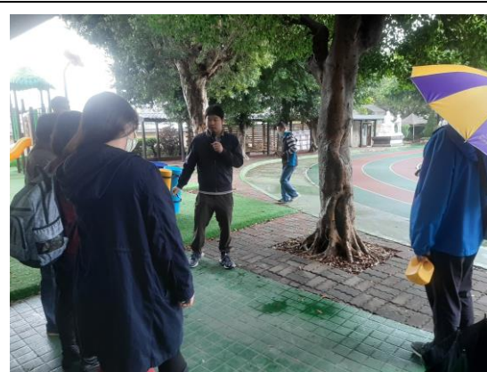
說明：教師護樹研習(上學期)