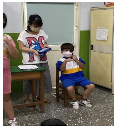
說明：學校護理師視力檢測