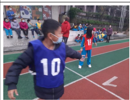
說明：戶外活動~高年級接力賽