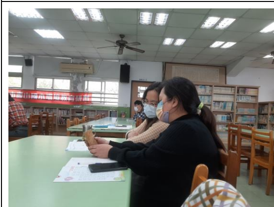
說明：教師護樹研習(下學期)