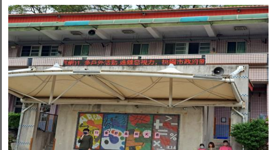
說明：視力保健跑馬燈宣導