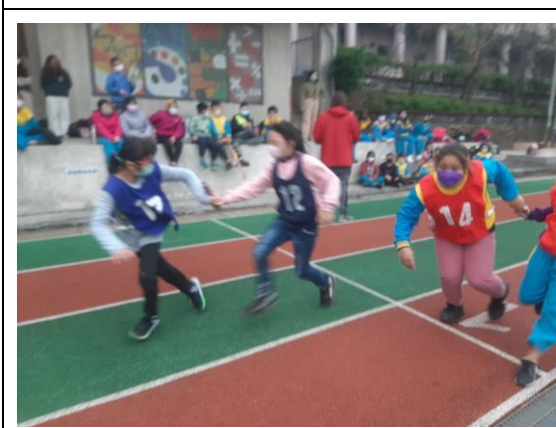
說明：戶外活動~高年級接力賽