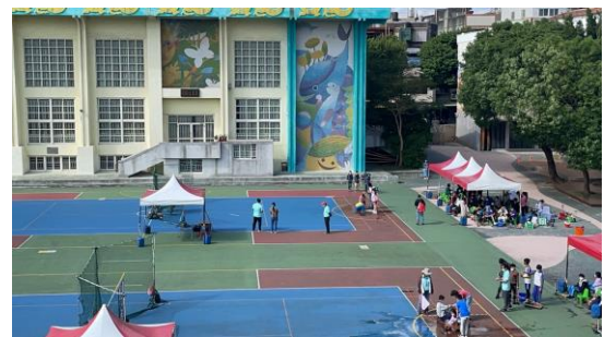
說明：戶外活動~桃園市水動力比賽