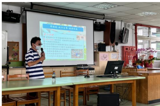
說明：新生座談會視力保健宣導