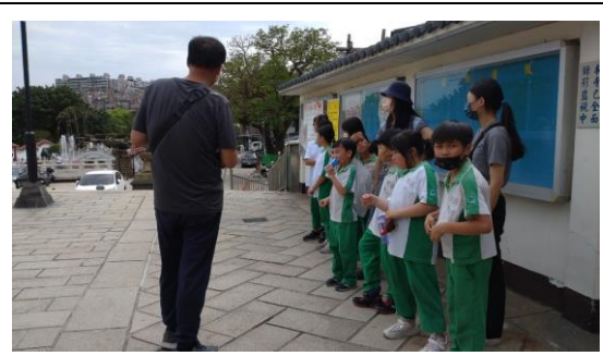
說明：壽山巖導覽活動