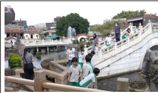
說明：壽山巖導覽活動