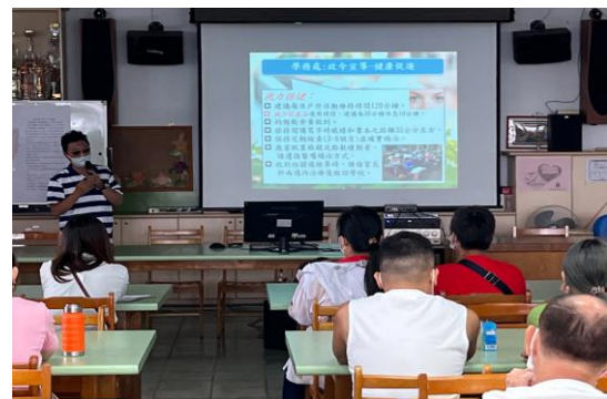
說明：新生座談會視力保健宣導