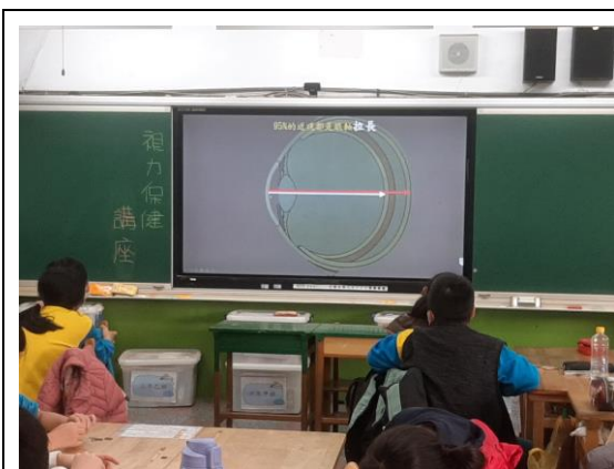
說明：長庚醫師到校宣導視力保健