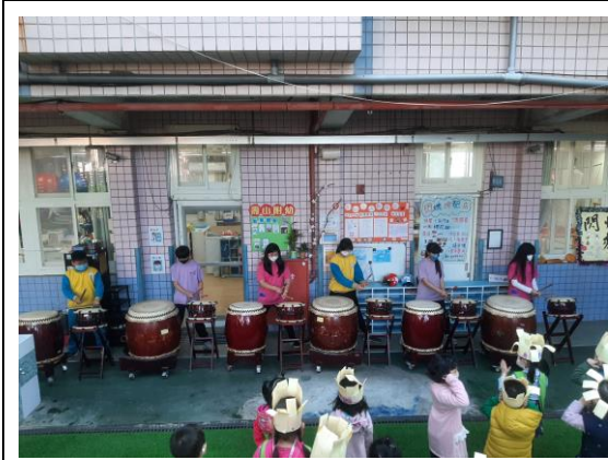
說明：戶外活動~太鼓表演