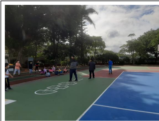
說明：戶外活動~跆拳道