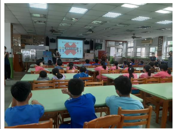
說明：正覺基金會保護自己講座