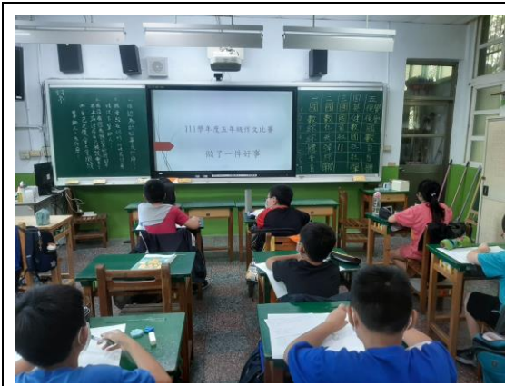
說明：正向心理健康藝文競賽