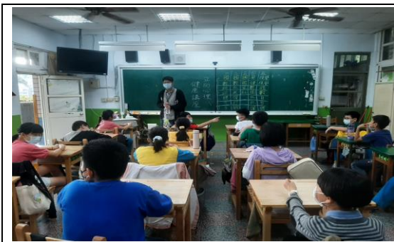
說明：心理師入班宣導