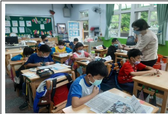
說明：讀報教育~好品德