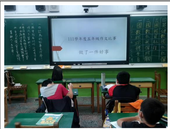
說明：正向心理健康藝文競賽