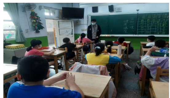
說明：心理師入班宣導