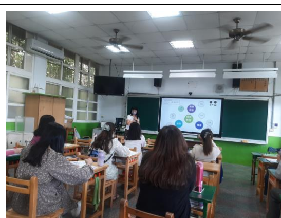
說明：情感教育講座