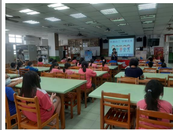
說明：正覺基金會保護自己講座