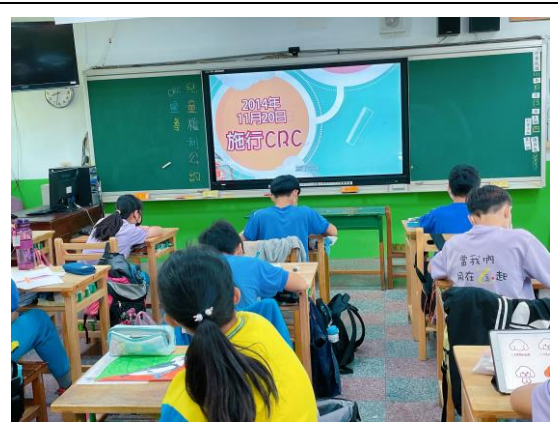
說明：兒童權利公約影片宣導