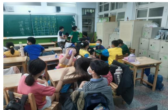
說明：心理師入班宣導