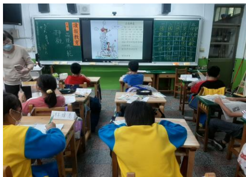
說明：讀報教育~好品德