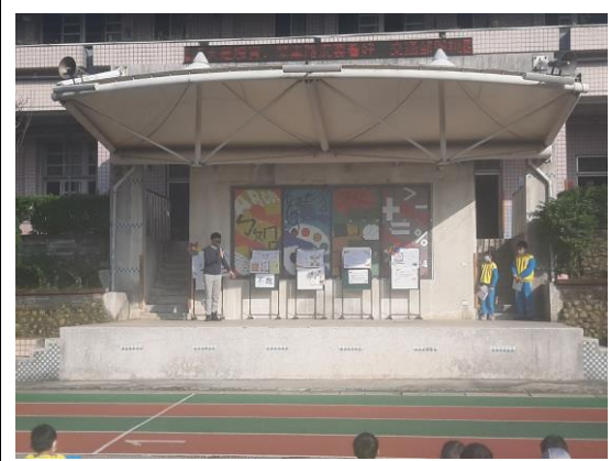
說明：友善校園宣導