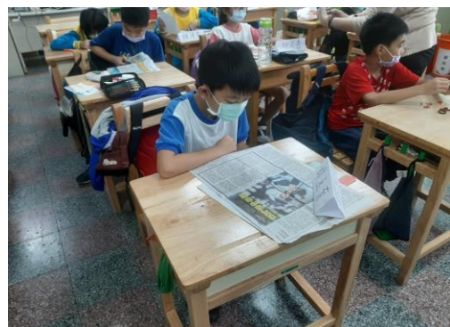
說明：讀報教育~好品德