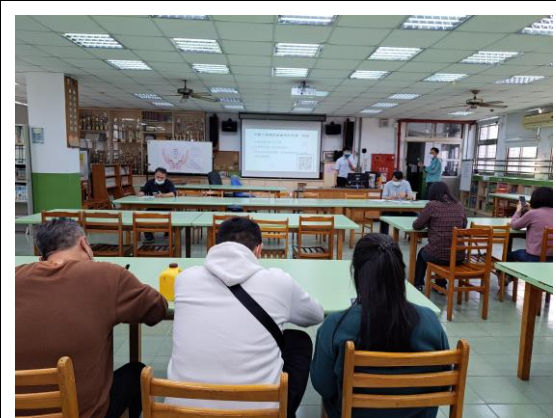
說明：兒童權利公約宣導