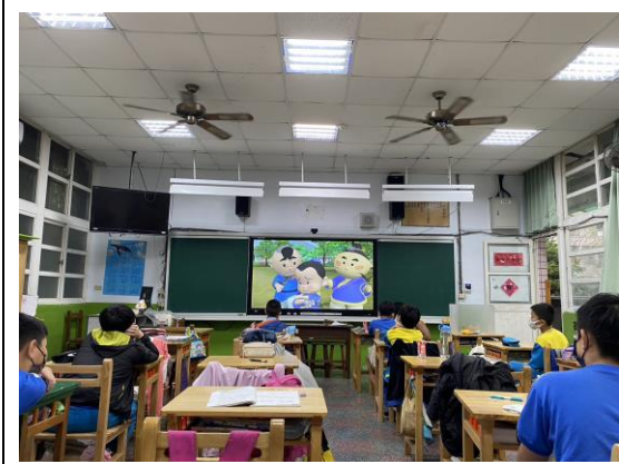
說明：正向心理健康影片宣導