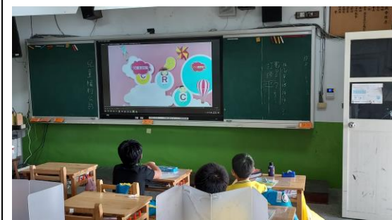
說明：兒童權利公約影片宣導