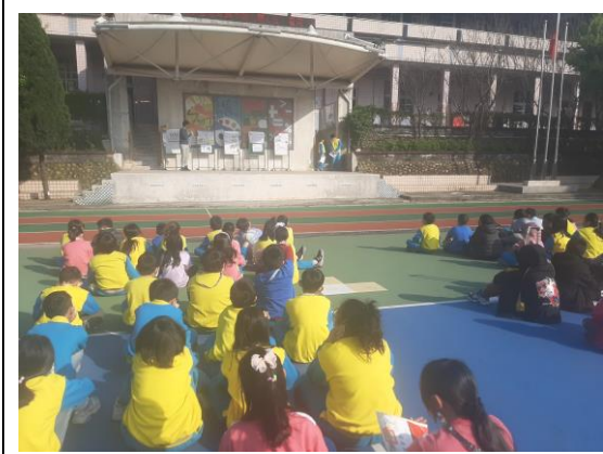
說明：友善校園宣導