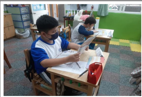
說明：讀報教育~好品德