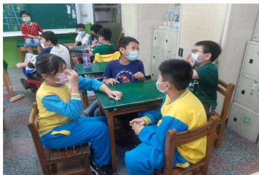
說明：心理師入班宣導