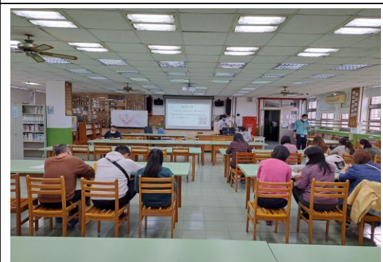
說明：兒童權利公約宣導