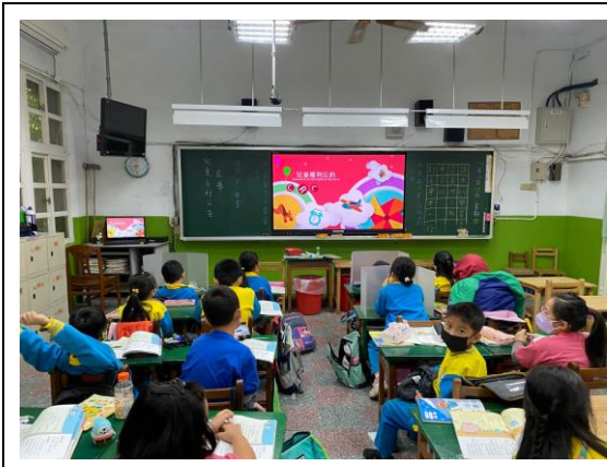
說明：兒童權利公約影片宣導