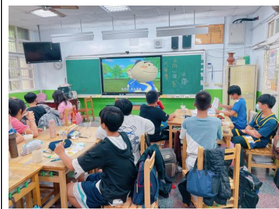
說明：正向心理健康影片宣導