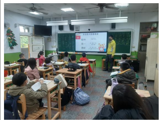
說明：數位性平教育宣導