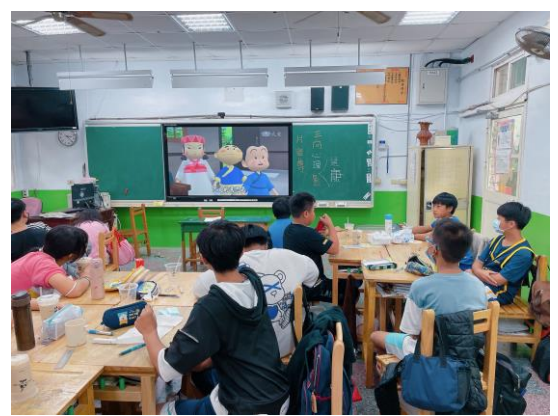
說明：正向心理健康影片宣導