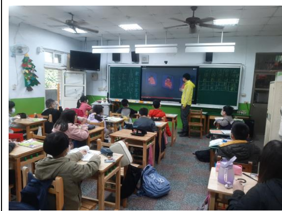
說明：數位性平教育宣導