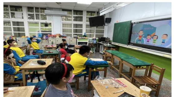
說明：兒童權利公約影片宣導