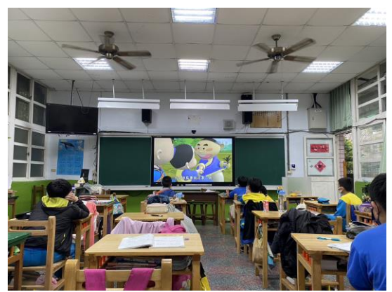
說明：正向心理健康影片宣導