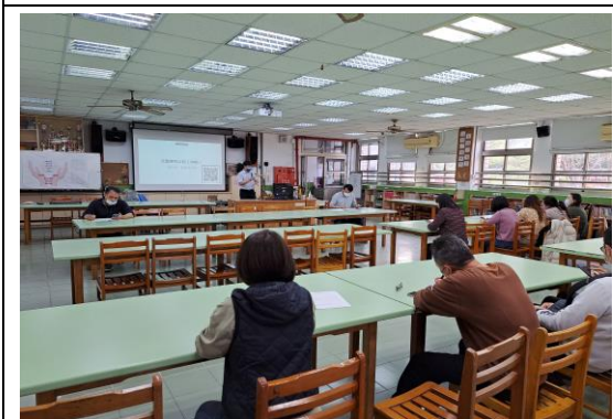
說明：兒童權利公約宣導