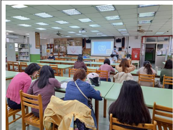
說明：兒童權利公約宣導