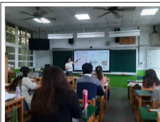
說明：情感教育講座