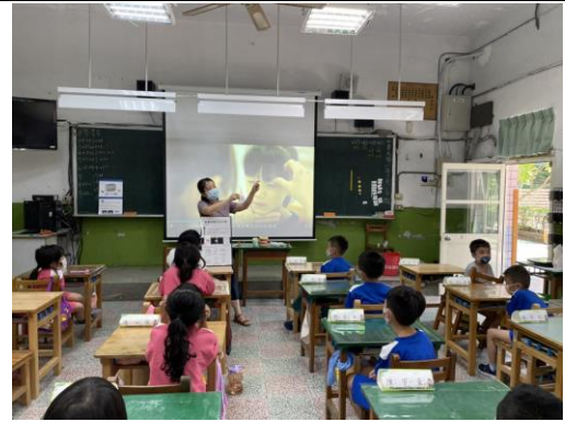
健檢檢體收集宣導