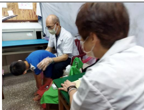
理學檢查(脊椎檢查)