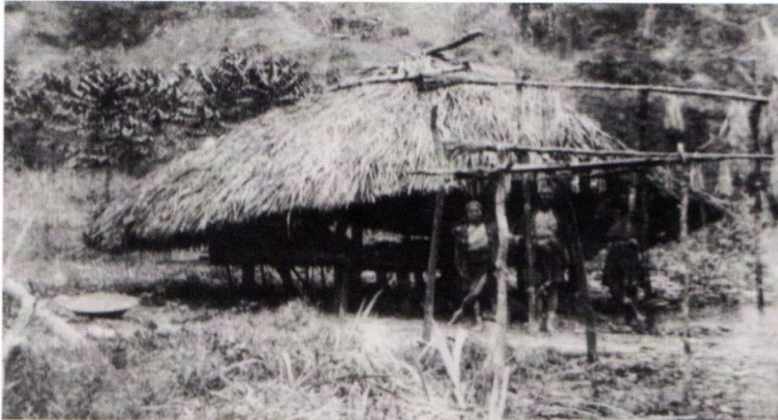
ガニ社では、男性だけが集落集会場に集まる。写真はそのタブライシィア (集落集会場) と思われる。