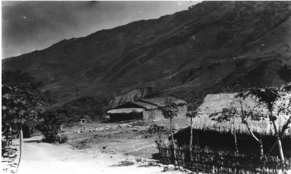
日據時期拉阿魯哇族家屋

傳統家屋形體多為長方形，單室不隔間，屋頂前後(棟的方向)兩端屋頂低，約二、三尺高，以茅草覆頂，其稜角頓而帶圓，立面看時，恰呈橢圓錐體狀。梁柱以黃櫨、檫樹、樟樹、茄苳、楠木、烏心樟等堅硬木材構成。牆壁則以茅草的莖直立排列，再以細藤編制為兩層。入口部分，左為男性入口、右為女性入口，另設有通往穀倉之門。屋內設有爐火、床臺、墓穴等。