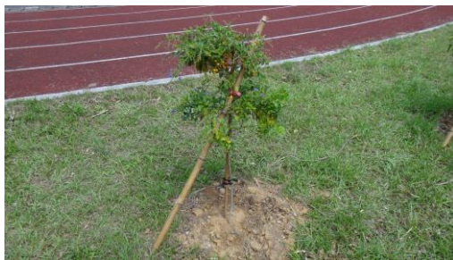
種植蝴蝶蜜源花卉