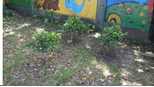
種植蝴蝶蜜源花卉及幼蟲食草