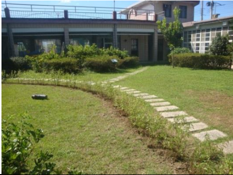
種植蝴蝶蜜源花卉及幼蟲食草