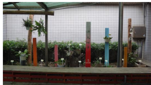
設置「蕨美世界」，種植蕨類植物