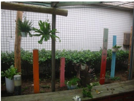
生物多樣性：種植蕨類植物