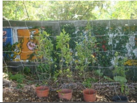
種植蝴蝶蜜源花卉及幼蟲食草