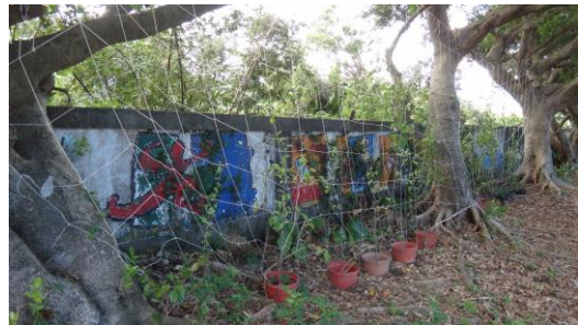
種植蝴蝶蜜源花卉及幼蟲食草