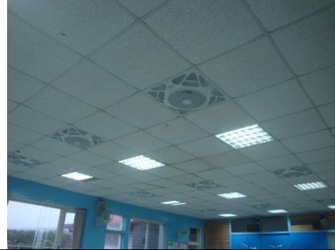
增設綜合教室循環扇 12 組