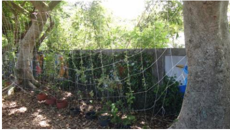
種植蝴蝶蜜源花卉及幼蟲食草