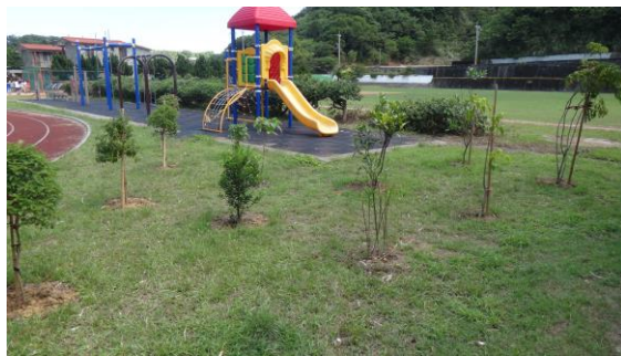
種植蝴蝶蜜源花卉及幼蟲食草