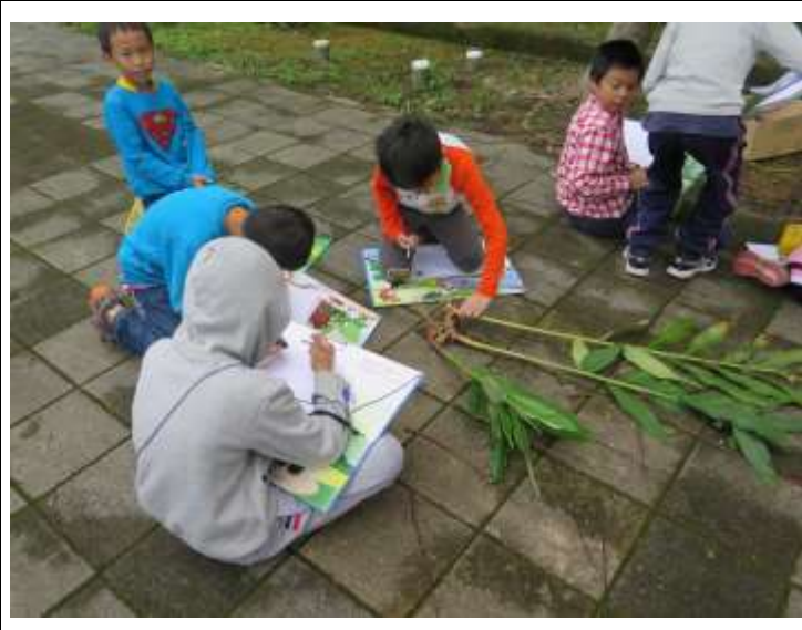
說明：摸一摸、聞一聞，和「薑」有何異同？