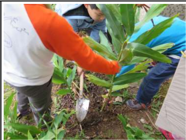
說明：幫助野薑花回家