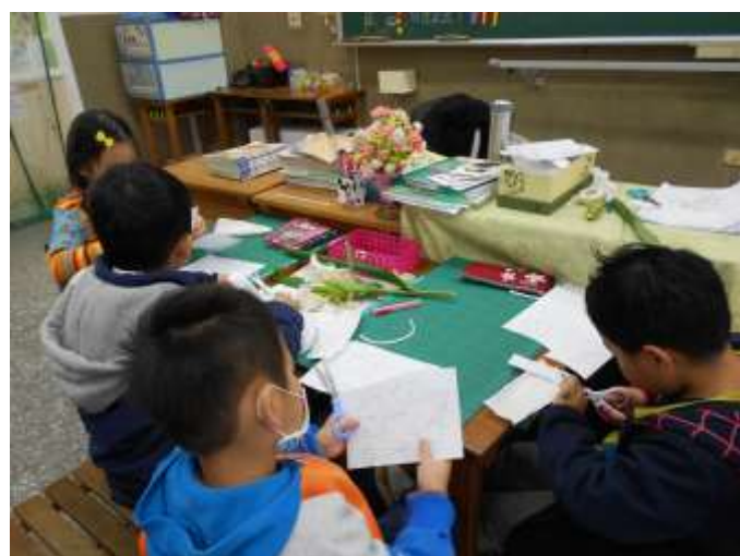
小朋友在充滿野薑花香的氛圍中進行創作