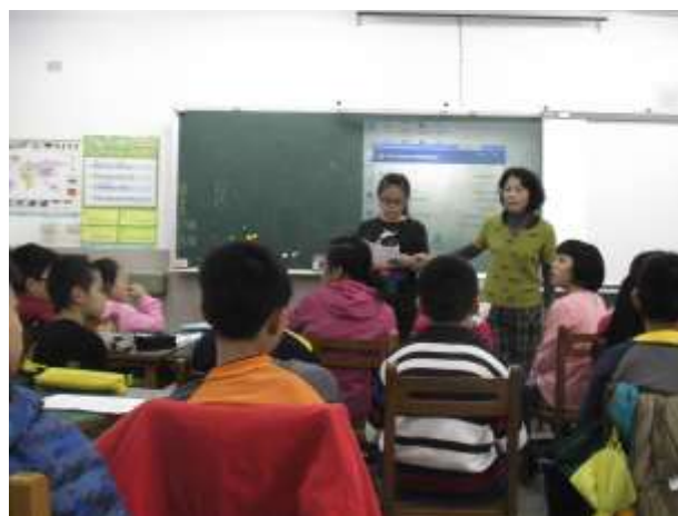
說明：學生分享個人「最喜愛的花」學習單內容