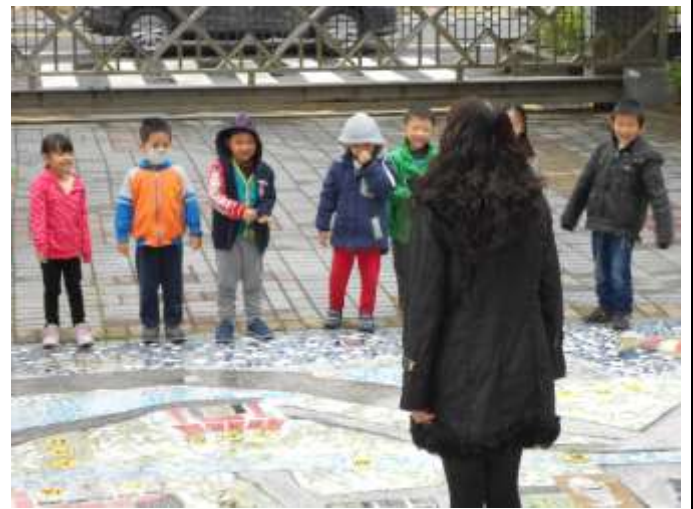
小朋友更進一步了解三坑河道及重要景點的相對位置