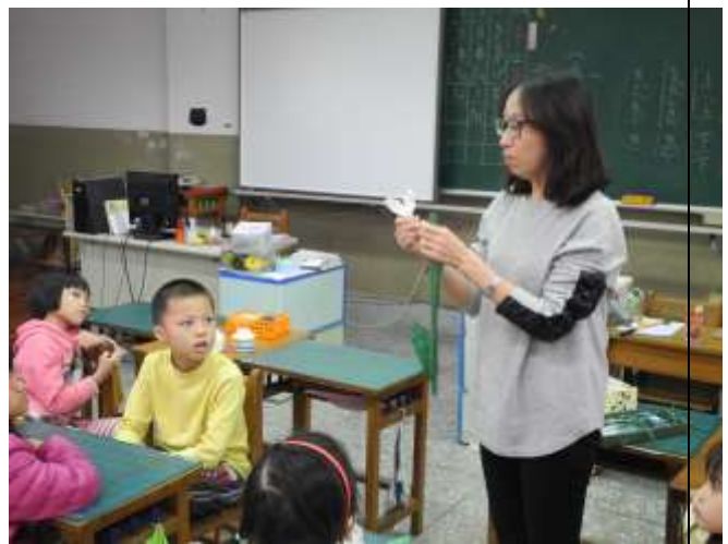
淑芳老師示範野薑花花束組合