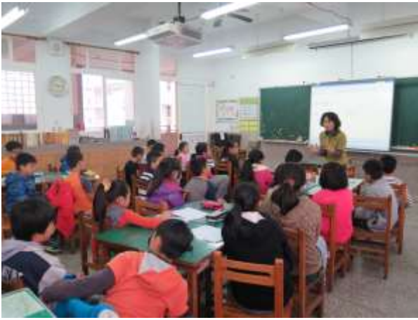
說明：語文概念分析與文本剖析引導學生深入體會寫作的要素與結構感覺。