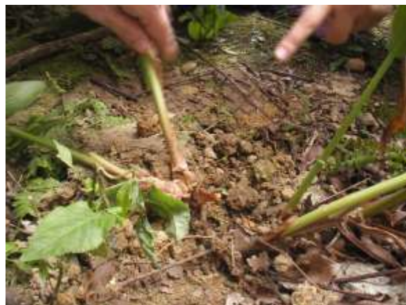
說明：野薑花的地下莖成塊狀可以實用喔。