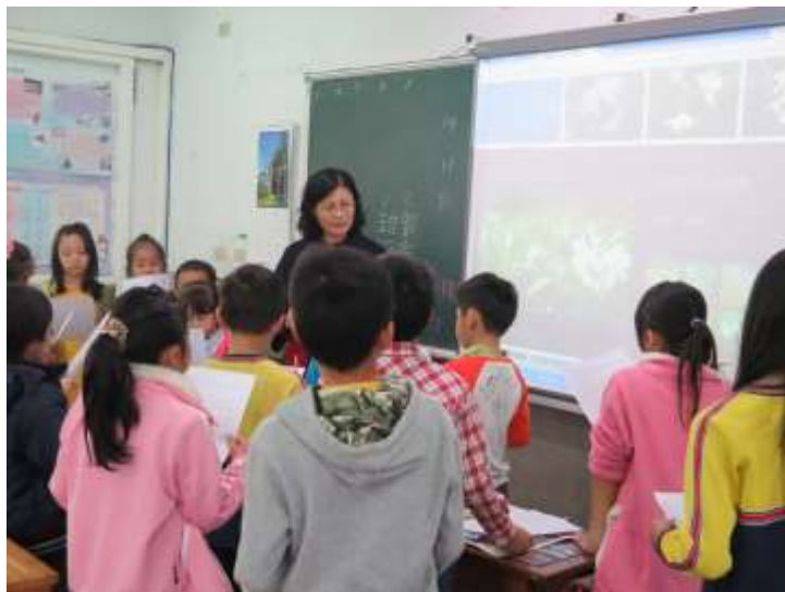
說明：尋訪野薑花行前說明