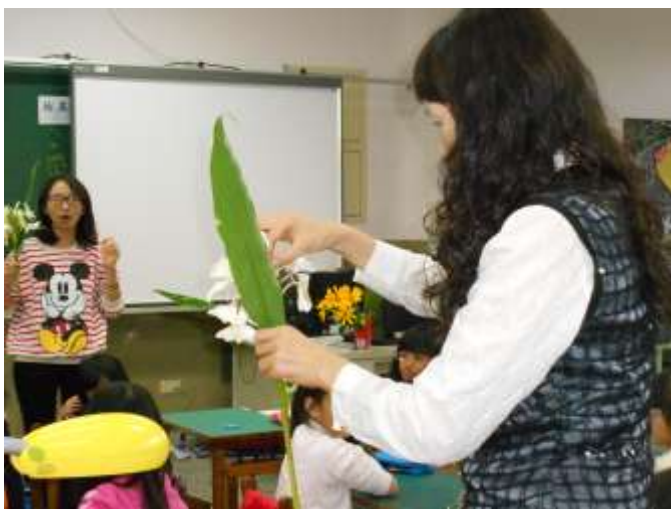
老師們精心準備野薑花，營造動機和氛圍