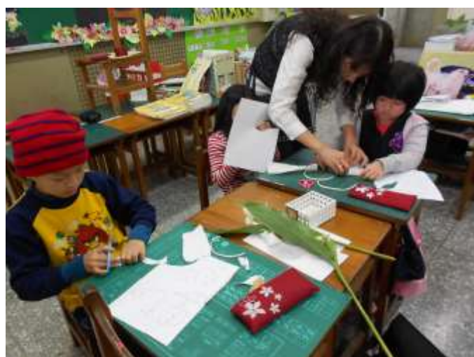
小朋友在充滿野薑花香的氛圍中進行創作