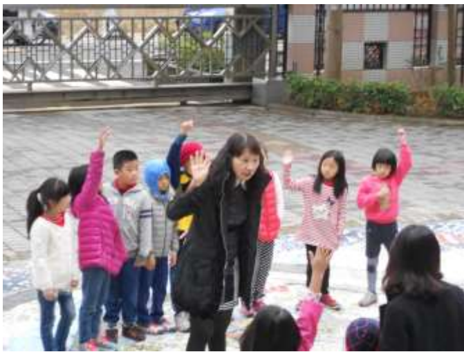
以小火車的隊伍進入校園前庭的三坑河道馬賽克地景圖