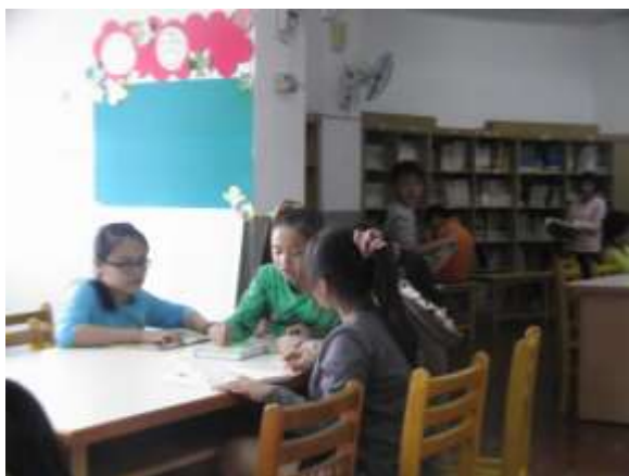
說明：學生先至圖書館找有關野薑花的植物圖鑑