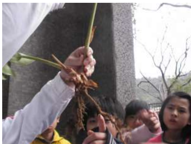
說明：仔細觀察野薑花的根莖與葉的構造。