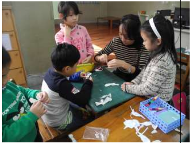
剪下的紙藤花瓣組合成野薑花朵