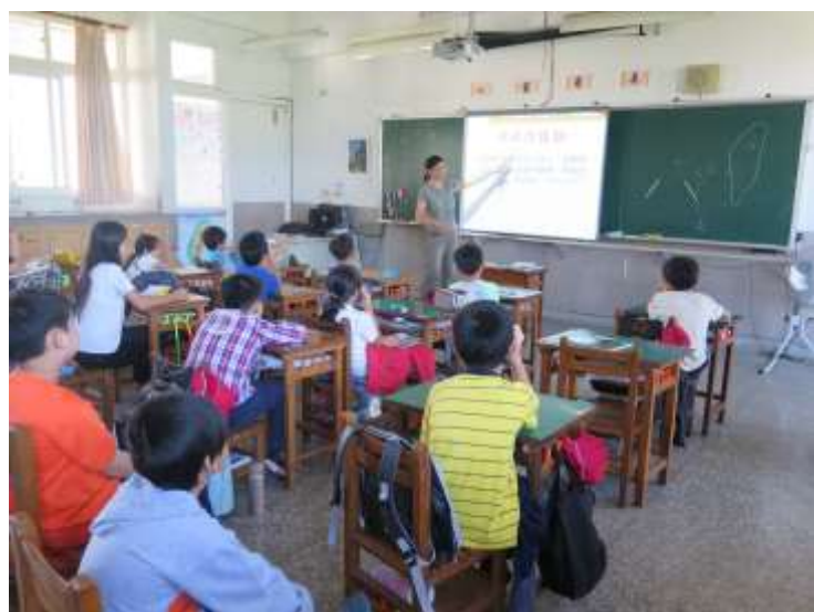
說明：水生植物簡報