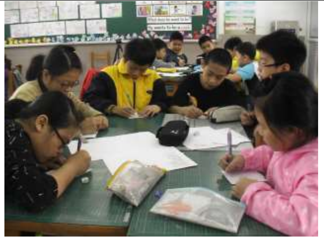
說明：高年級學生分組且分工進行「詠花」寫作