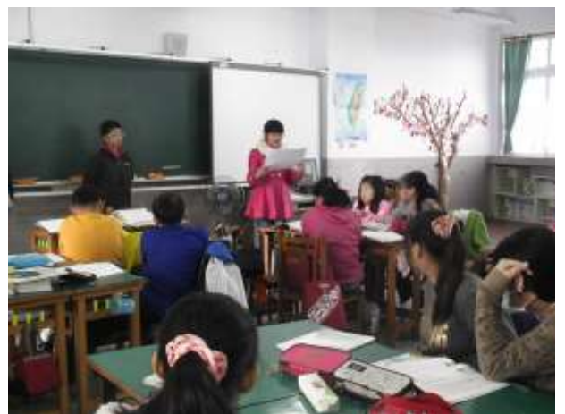
說明：完成後發表、欣賞與同儕批判。