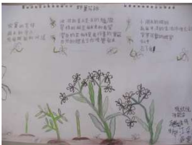
說明：小組書寫重組及插畫美編後的完成品