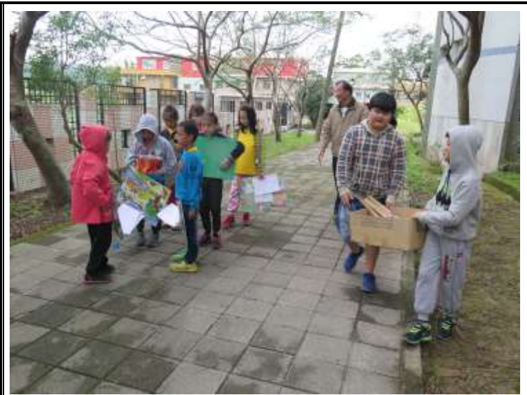
說明：收拾乾淨回教室