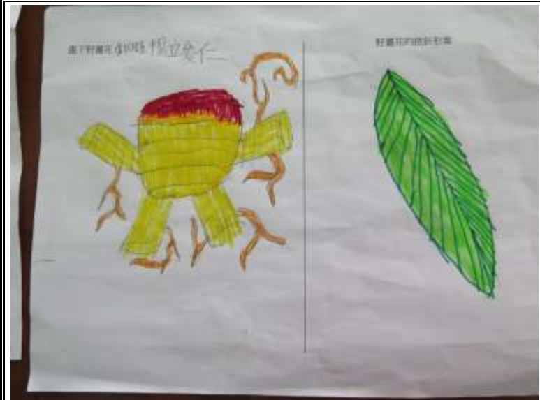
說明：野薑花的塊狀根莖和披針形葉