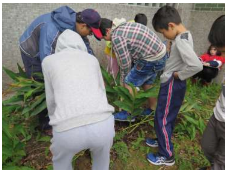
說明：教師示範如何挖取野薑花而不傷根莖