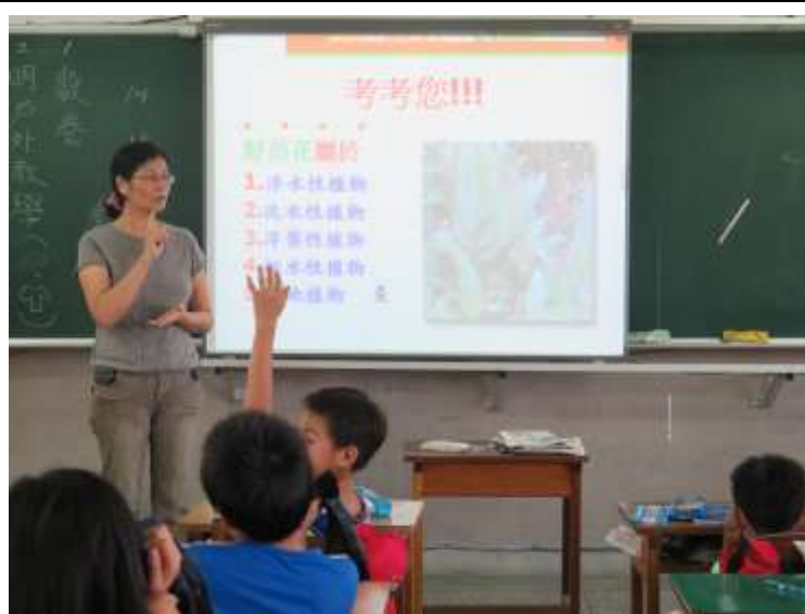
說明：小測試大考驗