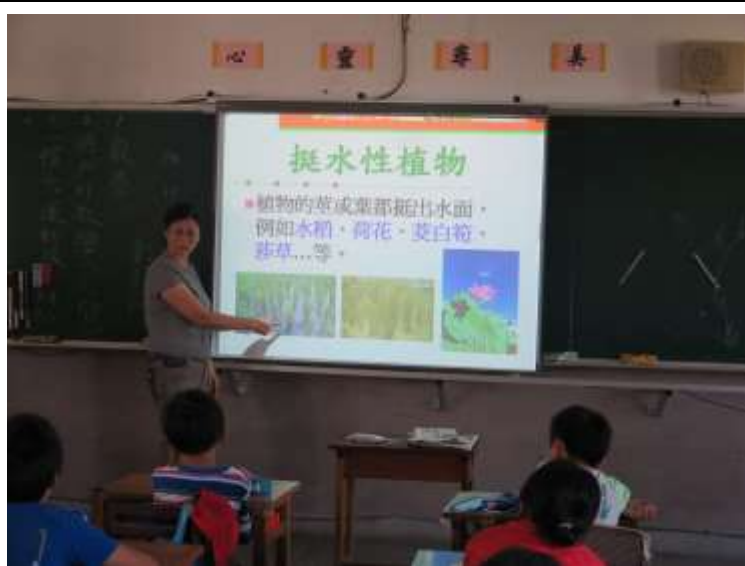
說明：各類水生植物特徵說明