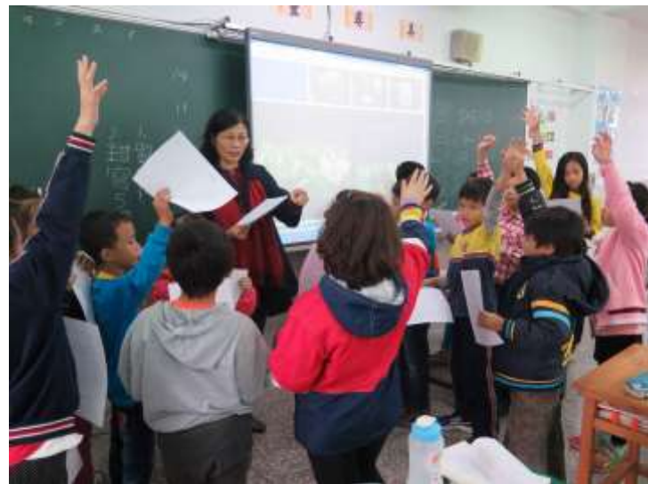
說明：我知道校園野薑花在何處