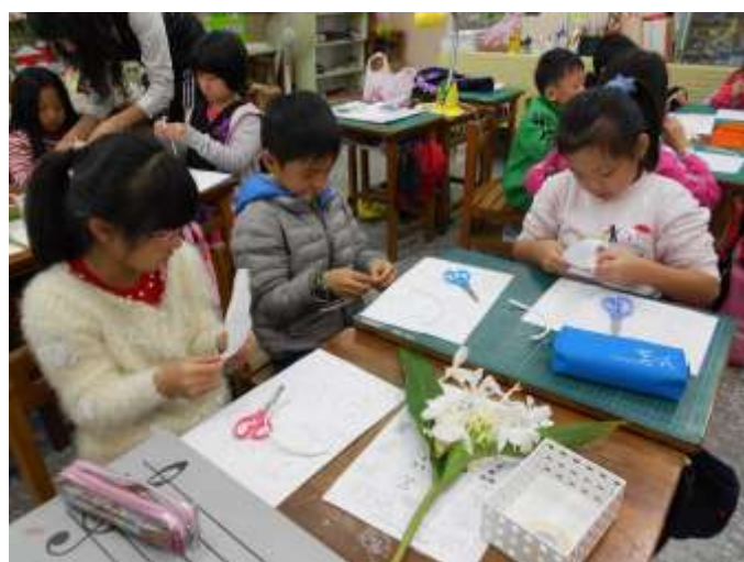
小朋友在充滿野薑花香的氛圍中進行創作