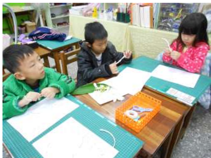
小朋友從展開紙藤開始