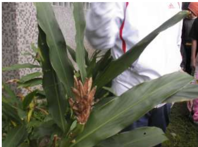
說明：從已枯萎的野薑花花苞片的功能講述