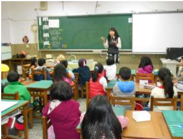
柑綾老師生動地講解「三坑」的意義