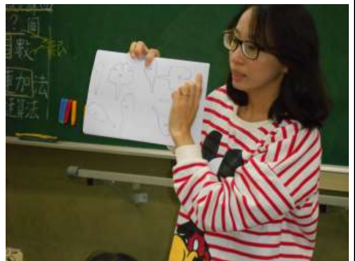
淑芳老師講解紙雕野薑花朵製作過程