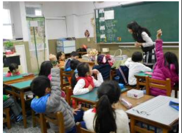
小朋友踴躍表達想法，與老師互動