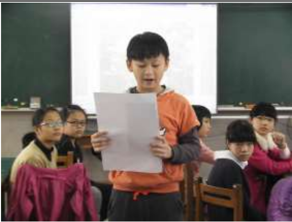
說明：同學代表小組分享第一階段尚未修飾的作品