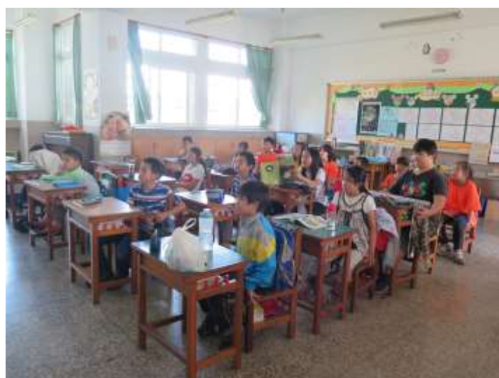
說明：全神貫注仔細聆聽