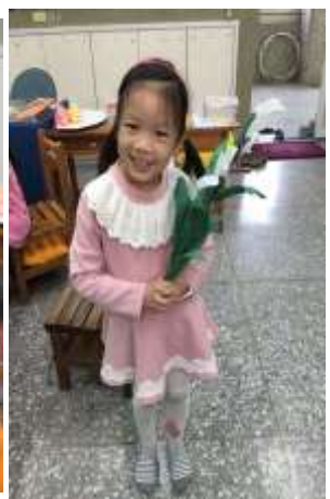
製作與完成野薑花花束