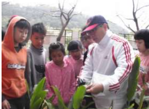
說明：志東老師帶學生至校園野薑花園區近觀學習