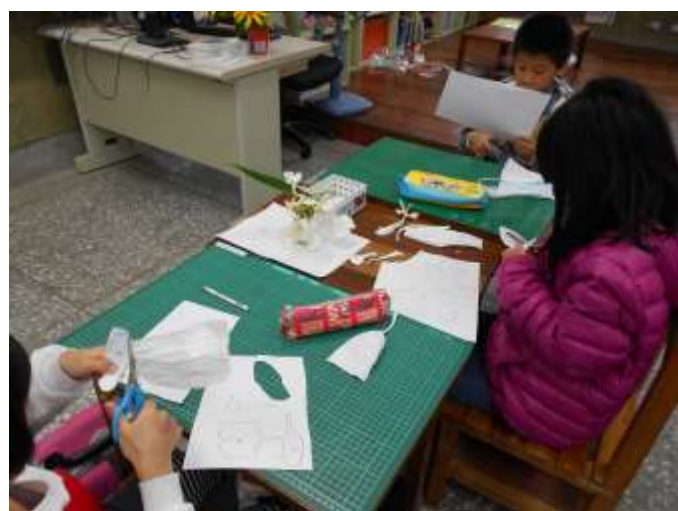
利用圖板剪下紙藤花片