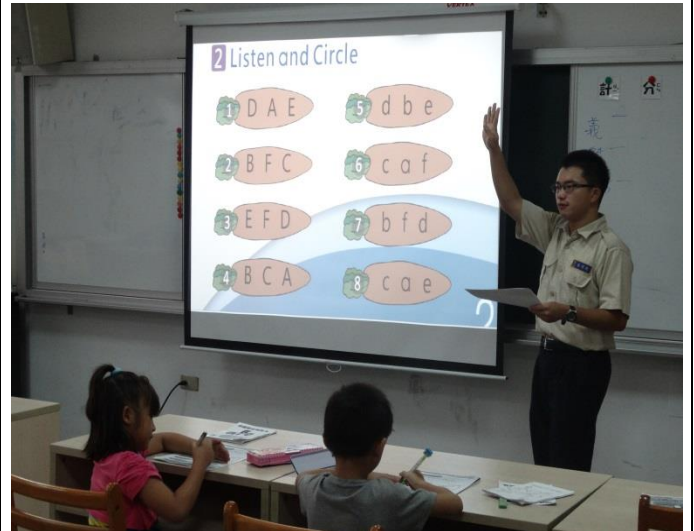
隨堂測驗瞭解學生的學習狀況