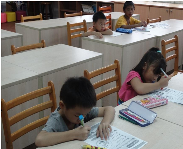
課堂練習加強學生讀寫能力