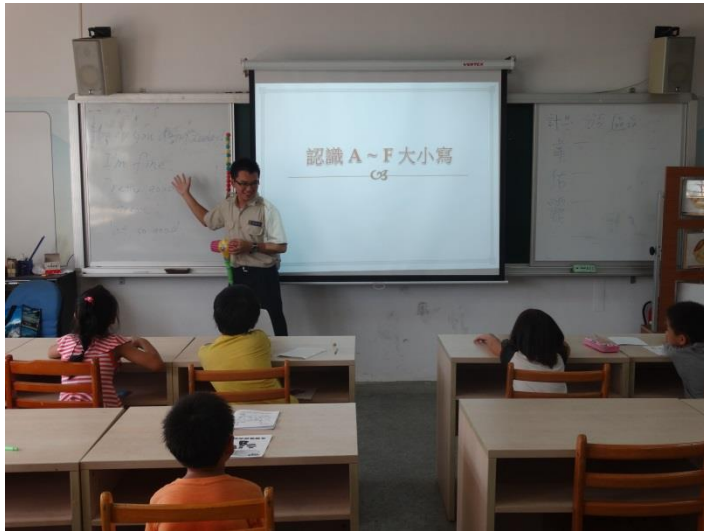
補救教學依學生程度與學習狀況進行教學