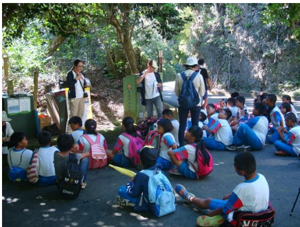
說明：期待大家都具有保育觀念