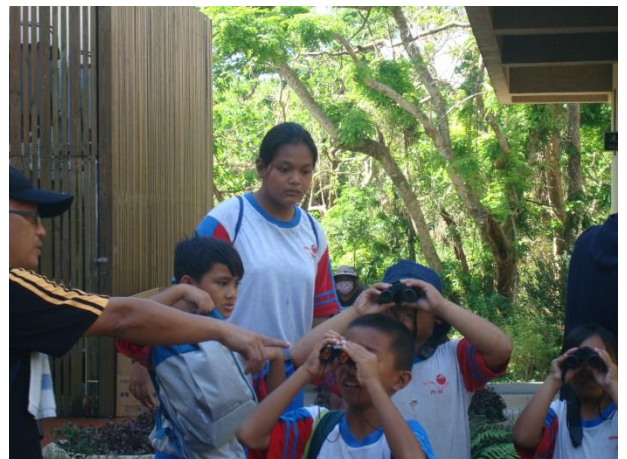
說明：望遠鏡使用教學