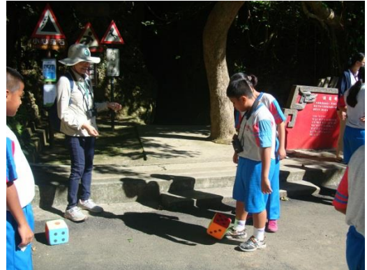
說明：候鳥遷徙過程中可能遇到的阻礙