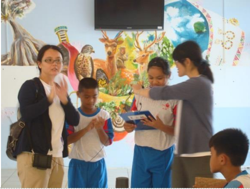
說明：各組成果分享