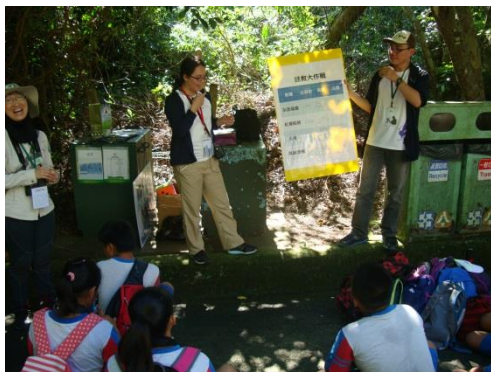
說明：導覽老師說明候鳥遷徙過程中可能會遇到的問題