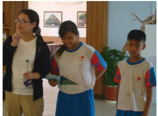
說明：我們這組主題是榕樹