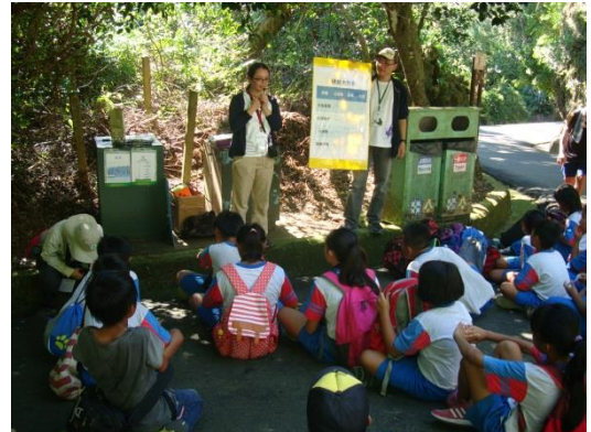
說明：介紹保護候鳥的方法