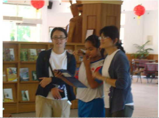
說明：說出我們這組的謎底