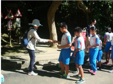
說明：模擬候鳥遷徙活動