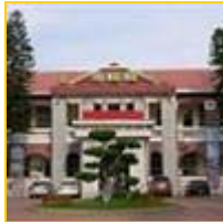
您好！市立公園國小 (213617)