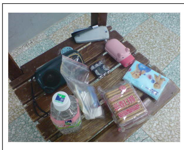
避難包裡必須物品