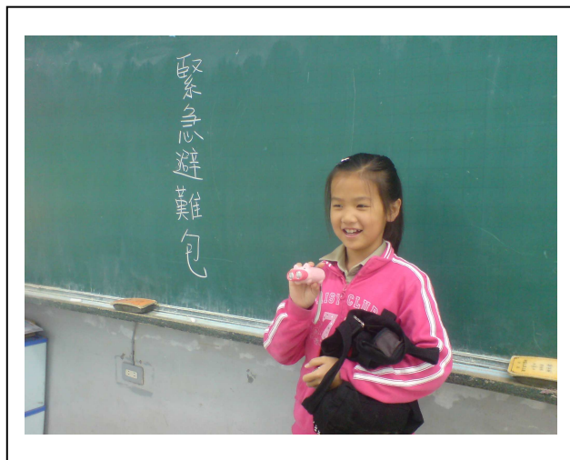
展示個人準備的避難包