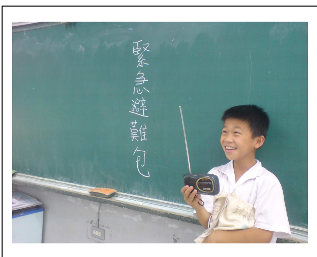
展示個人準備的避難包