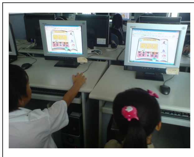
參與互動遊戲學習