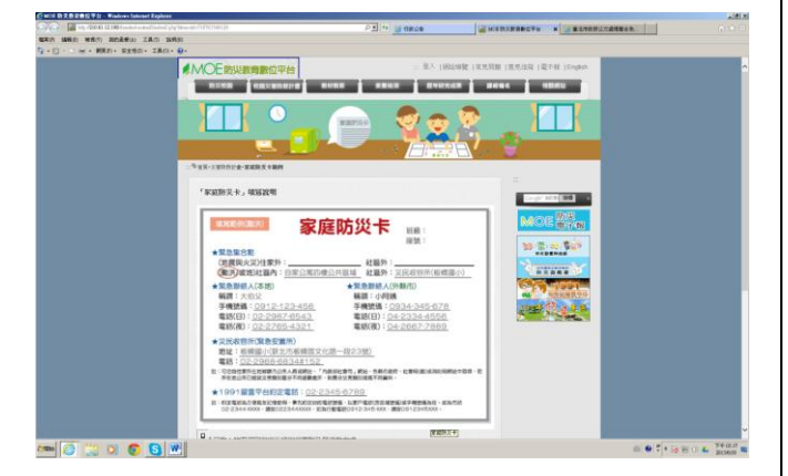
說明：家庭防災卡使用說明公告一景 1。