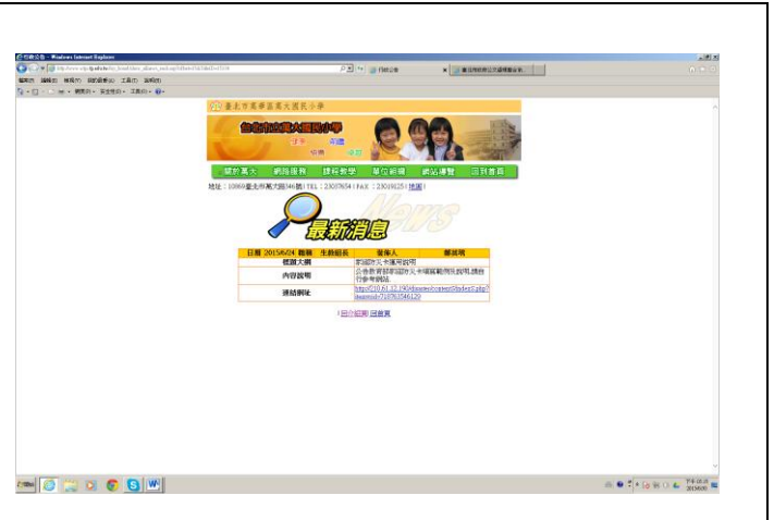
說明：於本校網頁公告家庭防災卡使用說明。