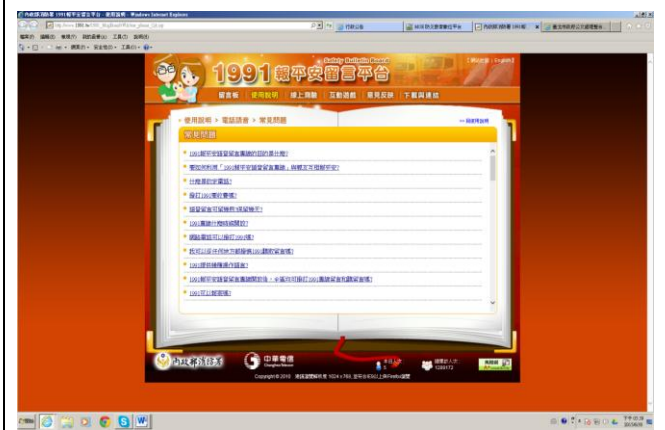
說明：1991 報平安留言平臺公告一景 1。