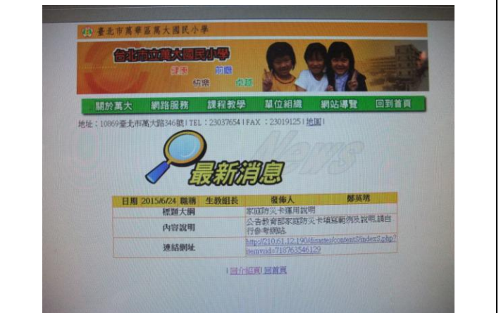
說明：家庭防災卡網路公告 2。