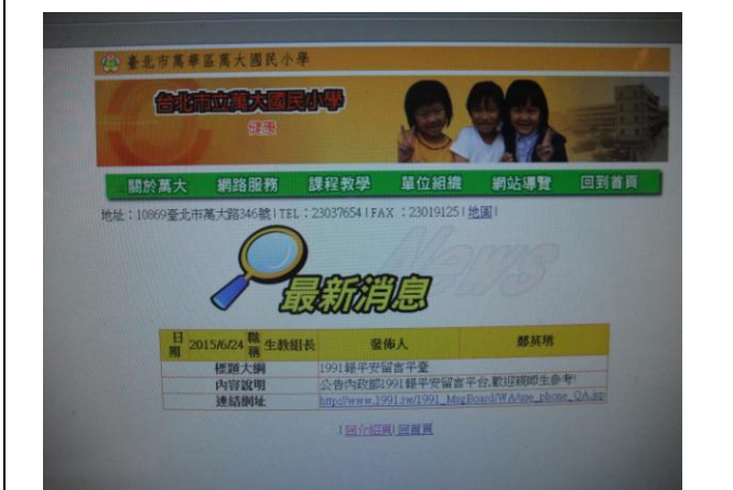
說明：1991 報平安留言平臺公告一景 2