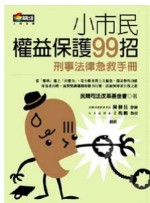
小市民權益保護 99 招

全套共有四個主題：<權威> (Authority)、<隱私> (Privacy)、<責任> (Responsibility)、<正義> (Justice)。這四個主題是公民價值和思想的核心，也是民主憲政理論與實踐的基礎