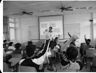
班級代表參與校規討論