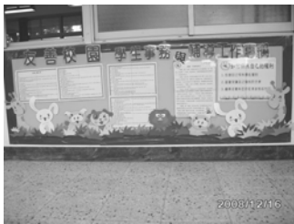
友善校園班級佈告欄