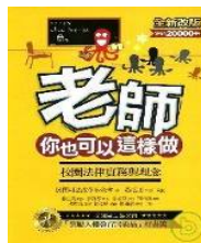
老師你也可以這樣做

這本書是由「世界人權宣言」裡的 30 條條款及法國插畫家威廉·威森生動的圖畫所結合而成的繪本，不僅令人賞心悅目，原本艱深的文字也變得淺顯易懂了。書中經常出現的圓形象徵的是一永恆、一致、地球以及生命；各樣的顏色則展現了一生命的積極及多元文化社會的活力。我們的生活正是藉由這樣的方式與他人產生連結。