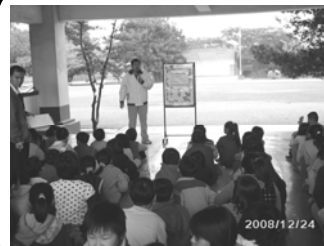
學生權益維護宣導