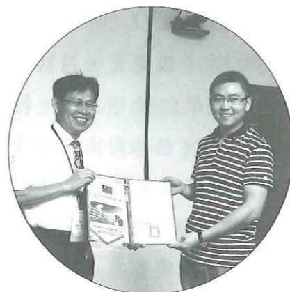
1050810 參訪上海華東師範大學終身教育研究院

隨著老年人口的增加，老年教育越來越受到政府的關注。新北市是全台第一大城市，在全台人口老化趨勢中，高齡者人口數最多。截至2014年6月，65歲以上高齡者達38萬7450人。為了讓這些高齡長者能夠安心樂活，市政府推出「老人五安服務」、「高齡照顧存本專案」，希望借助佈老及世代志工的力量，服務社區老人。