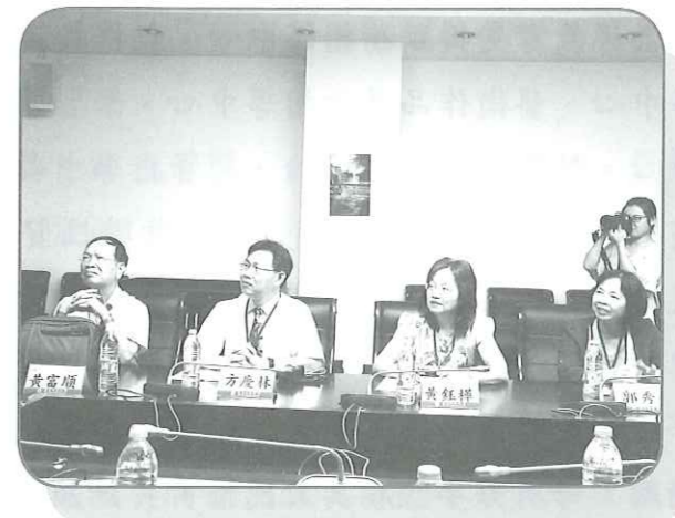
1050810 參訪上海華東師範大學終身教育研究院

上海市2015年，全市人口2415.27萬人，常住人口1442.97萬人，60歲以上老年人口435.95萬人，占常住人口比例30.2%，預計到2020年會攀升到36%，顯現老年人口增加之快速。80年代初期，上海市市級老年大學只有四所，包括上海