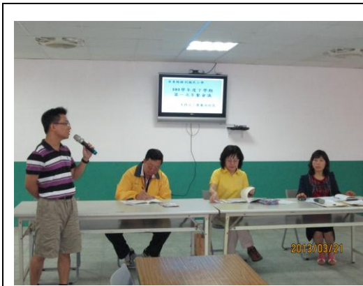
午餐會議成果照片