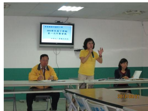
午餐會議成果照片