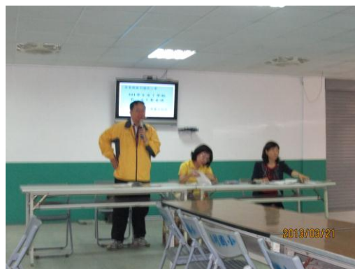
午餐會議成果照片