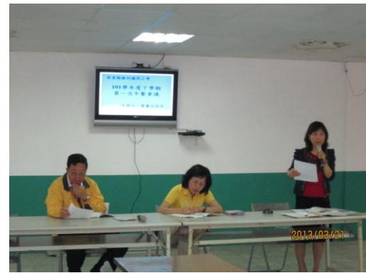
午餐會議成果照片