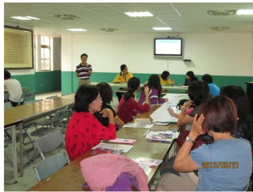
午餐會議成果照片